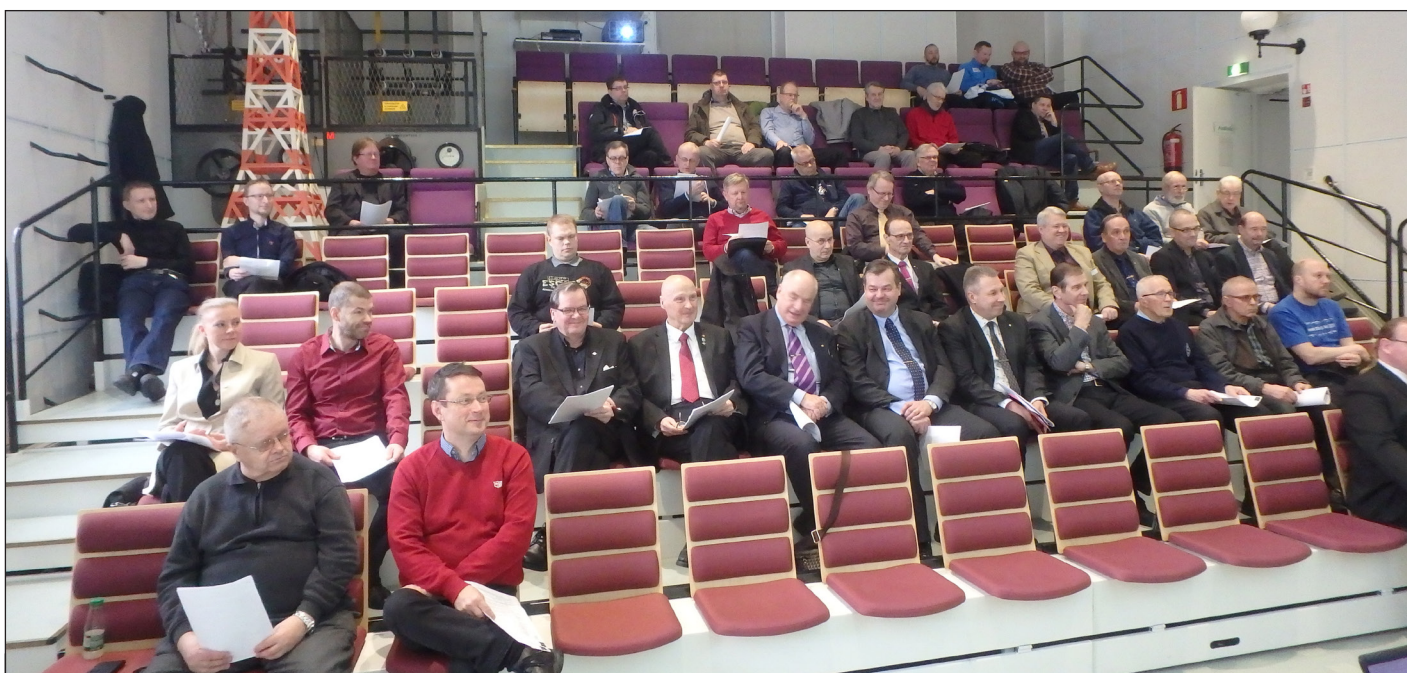
Päijät-Hämeen Viestikillan perustavan kokouksen väkeä 4.3.2017 Lahden Radio- ja TV-museo Mastolan auditoriossa.

Päijät-Hämeen Viestikillan perustava kokous pidettiin Lahden Radio- ja TV-museo Mastolasassa lauantaina 4.3.2017. Perustavaan kokoukseen Mastolan auditoriossa osallistui erilaisissa rooleissa yhteensä lähes 50 ihmistä kautta Etelä-Suomen.