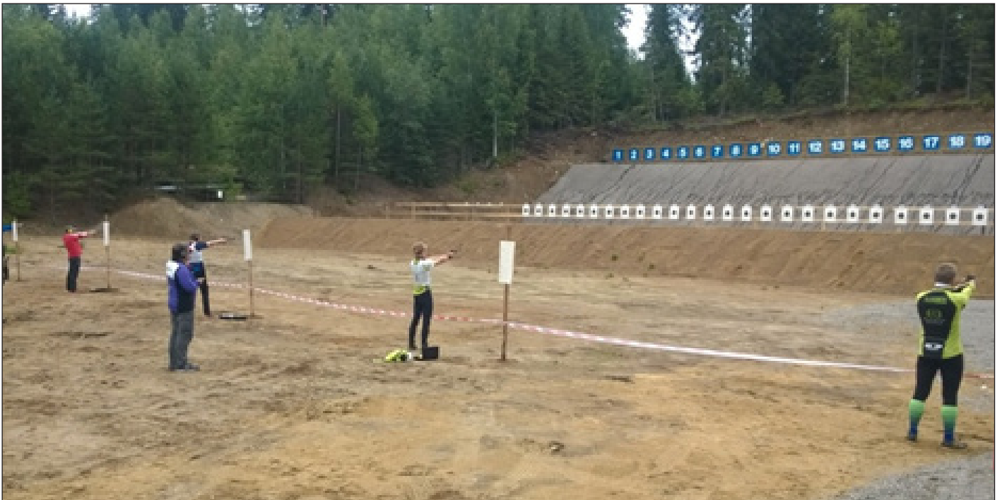
Ammunta oli ensimmäisenä lajina, joka suoritettiin 5 henkilön ryhmissä viereisellä ampumaradalla. Aseena pienoispistooli.