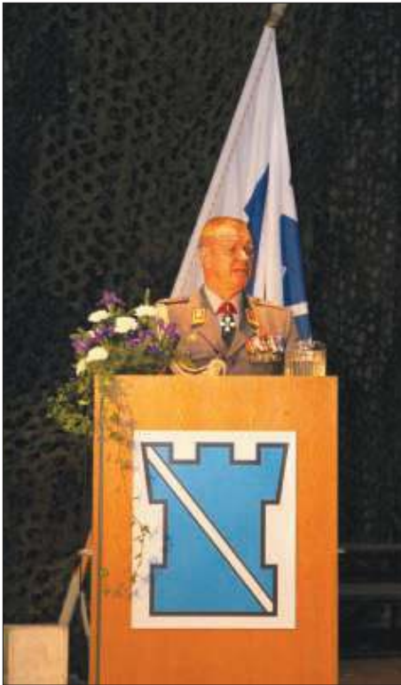
Juhlapuheen piti Länsi-Suomen Sotilasläänin komentaja kenraalimajuri Juhani Kääriäinen.

Maanpuolustuskilat haluavat olla kiinteästi mukana maanpuolustuksen kehittämisessä