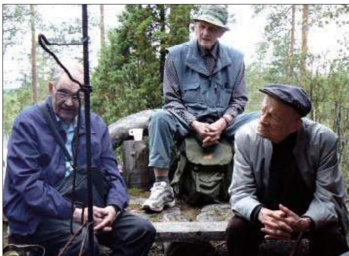
Kuvat ovat jokavuotisesta veteraanien heinäkuisesta savusaunareissusta jota vietetään Nastolan Reserviupseerierien savusaunalla karhulammin rannassa. Järjestelyt ovat hoituneet mallikkaasti yhdistystemme yhteistyöllä.