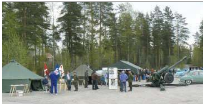
Olemme vähintään kerran vuodessa olleet mukana joko Nastola viikon tapahtumassa esittelemässä paikallista reserviläistoimintaa tai Wanha-Willähti kerhon järjestämässä viikonloppun mittaisessa tapahtumassa jossa olemme muun muassa yhteistuumin vastanneet alueen vartioinnista.