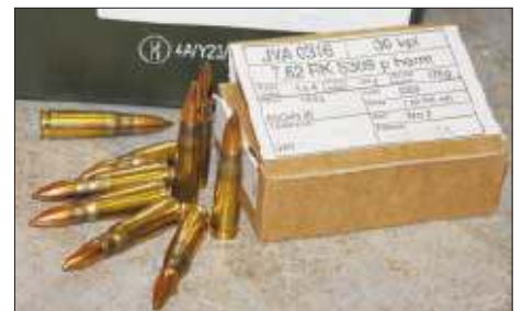
Oikeat patruunat oikein käytettynä oikeassa paikassa ovat turvallisuuden ta.

Teksti ja kuva: Kapteeni Ari Pakarinen, alueupseeri