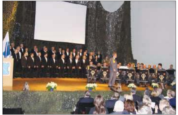
Yleisö sai nauttia kuorolaulusta ja sotilassoitosta.

Kääriäinen esitteli perusteita puolustusvoimien uudistamiselle. Puolustusvoimien rakenteiden uusiminen ja mm. alueellisten johtamisorganisaatioiden tarkastelu on edellytys, sille että