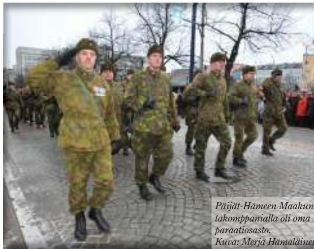
Päijät-Hämeen Maakuntakomppaniolla oli oma paraatiosasto.

Päijät-Hämeen Reservipiiri: www.asapen.net/respiiri Reserviupseeriliitto: www.rul.fi Reserviläisliitto: www.reservilaisliitto.fi Reserviläisurheiluliitto: www.resul.fi Maanpuolustuskoulutusyhdistys: www.mpky.fi Puolustusvoimat: www.mil.fi MP-myymä: www.maanpuolustusyhtio.fi