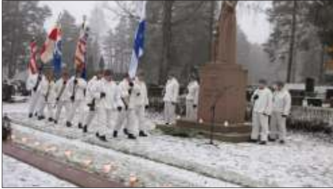
Kunniavartio saapuu paikalle lumipuvuissaan.