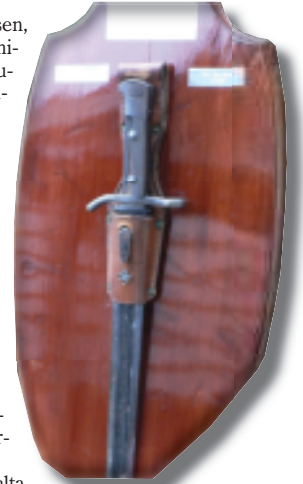
Orimattilan Vuoden Reserviläinen -kiertopalkinto on Heinänselle lämmitettyä tunnustusta tehdystä työstä.

nulle tärkeää, muttei koko elämä. Ylipäättään näin itsenäisyyspäivän jälkimainingeissa voisi muistaa, että meillä suomalaisilla on paljon ylpeydenaiheita sotakenttien taisteluiden lisäksi.