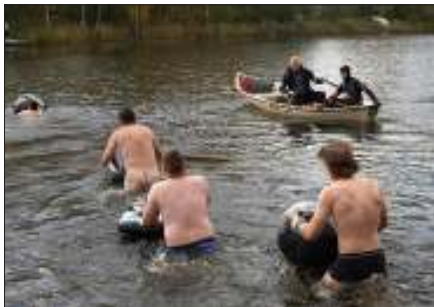
Mallisuoritus vesistön ylityksestä.

Teksti: JANNE-PEKKA JUUTILAINEN Lisää jotoksen nettisivuilla: www.rul.fi/terri