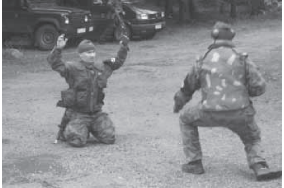
Kolmas joukkue harjoittelee kiinniottoa.

Reserviläisten joukoissa oli SPOL-koulutettuja, vartiojoukkojen henki-