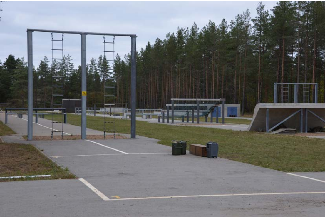
Männikun esteradalla järjestettiin mm. CIOR:n kansainväliset Milcomp-kisat muutama vuosi sitten.