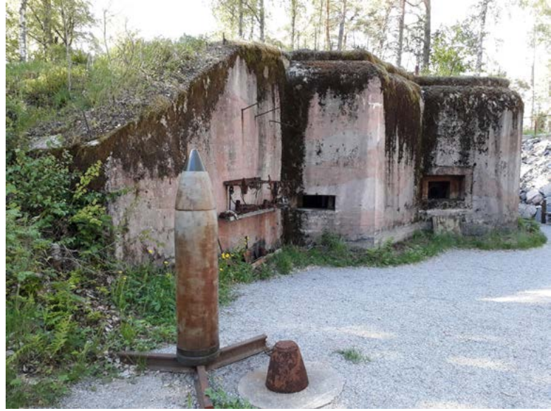
Irma-bunkkeri nro 302 kuuluu Harpaskogin puolustuslinjaan, jonka rakennustyöt aloitettiin pikavauhtia talvi- ja jatkosodan välisenä aikana. Vasemmassa aukossa on konekivääri ja oikeassa panssarintorjuntatykki. Katolla on panssarikupu tähyystystä varten.

Irma-bunkkeri miehittettyä heinäkuussa 1941.