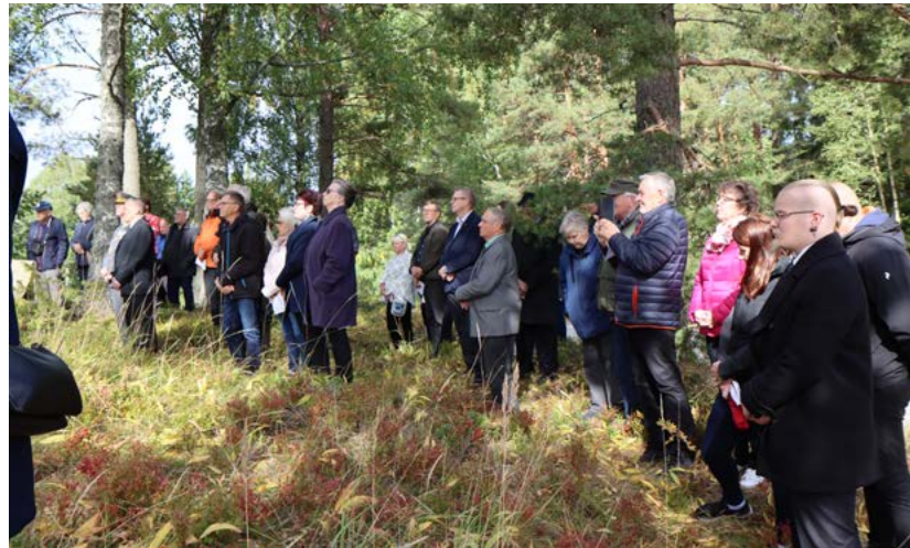
Yleisöä saapui Nyystölään kunnostettua muistomerkkiä kunnioittamaan kiitettävästi, ja syyskuun aurinkokin kunnioitti tilaisuutta läsnäolollaan.