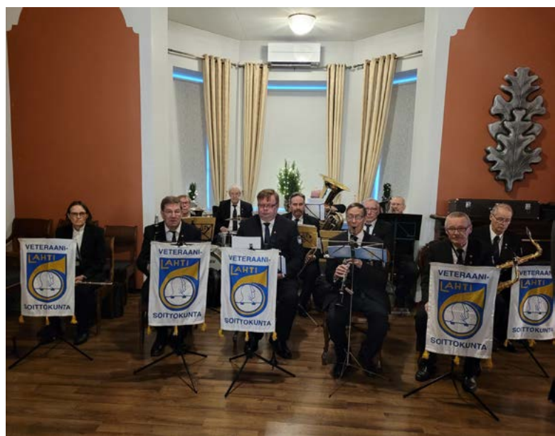
Tilaisuuden musiikista huolehti Lahden Veteraanisoittokunta.