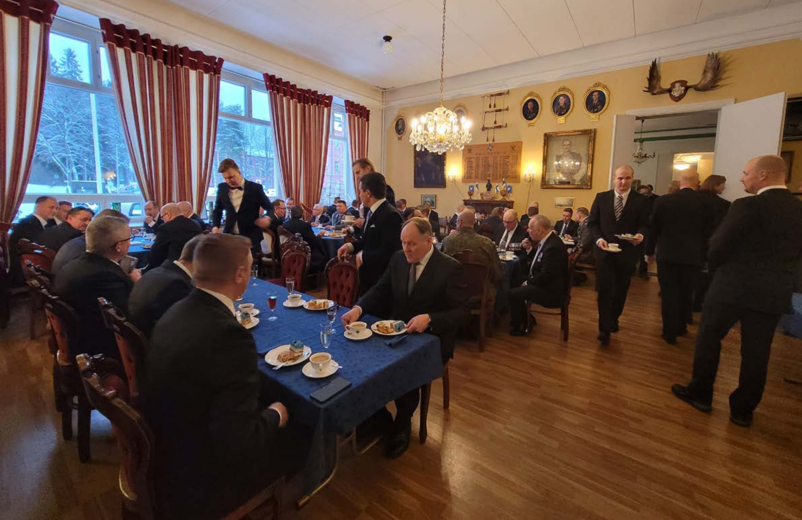
Ylentämis- ja palkitsemistilaisuuden jälkeen vietettiin kahvihetki. Juhlaväkeä oli paikalla niin paljon, että Upseerikerhon kaikki salit olivat täynnä.