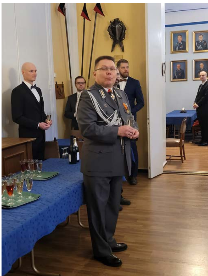
Panssariprikaatin apulauskomentaja, eversti Oula Astelmäki tervehti juhlaväkeä kahvihetken aluksi.