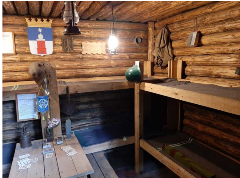
Bunkkerissa on kolme huonetta: yksi konekiväärille, yksi tykille ja yksi majoitukselle. Sota-aikaan bunkkerissa majoittui 16 sotilasta.