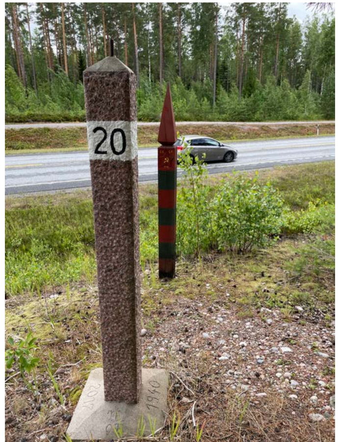
Tammisaaren-Hangon välistä maantietä ajaessa kohti Rintamamuseota törmää vavahduttavaan näkyyn. Tienpenkalla on kahden valtakunnan rajapyykit, toista koristaa punainen tähti.

Merivoimien komentaja jääkärikenraali Väinö Valve antoi 15.3.1940 käskyn Hankoniemen alueen puolustamisesta. Samassa käskyssä määrättiin Harparskog-linjan rakentaminen sekä itärajan Salpalinjan rakentaminen.