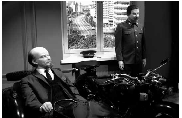
Josif Stalin (oik.) saapui syksyllä 1917 Suomeen ja osallistui sosiaalidemokraattien puoluekokoukseen. Hän opasti hengenheimolaisiaan ottamaan nopeasti vallan maassa. V.I.Lenin (vas.) lähetti aateveljilleen tavoitteellisen viestin: ”Nouskaa viivyttelämästä ja ottakaa valta järjestäytyneen työväen käsiin.”