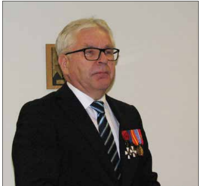
MPK:n apulaispiiripäällikkö avasi kattavasti MPK:n 25-vuotista historiaa.