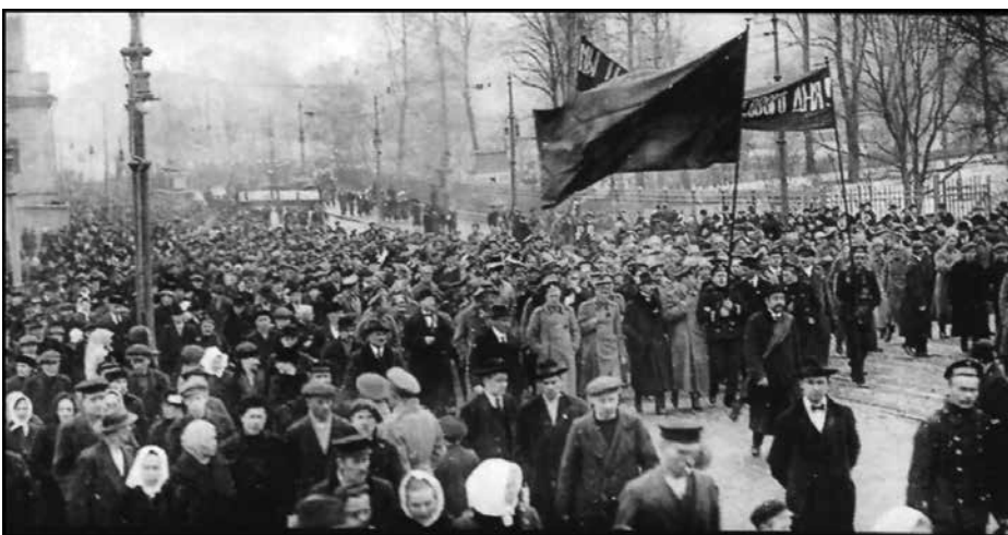
Mielenosoitus kahdeksan tunnin työpäivän puolesta yleislakon aikana 1917 Helsingin Kaisaniemessä. Huomio kiinnittyy venäläisten sotilaiden merkittävään määrään.

Leninin johtamien bolsevikkien tavoitteena oli vallitsevan yhteiskunnan rakenteiden täydellinen kumoaminen. Puolueen oli oltava tiukasti johdettu, kurinalainen ja sen piti koostua elitistisestä vallankumouksellisten etujoukosta. Bolsevikit eivät hyväksyneet ajatusta suuresta työväenliikkeestä ja sitä, että työväenpuolueen piti rakentua suurten massojen joukkovoimalle. Venäjän bolsevikkien toiminta perustui väkivaltaan ja proletariaatin diktatuuriin, joka Leninin mukaan