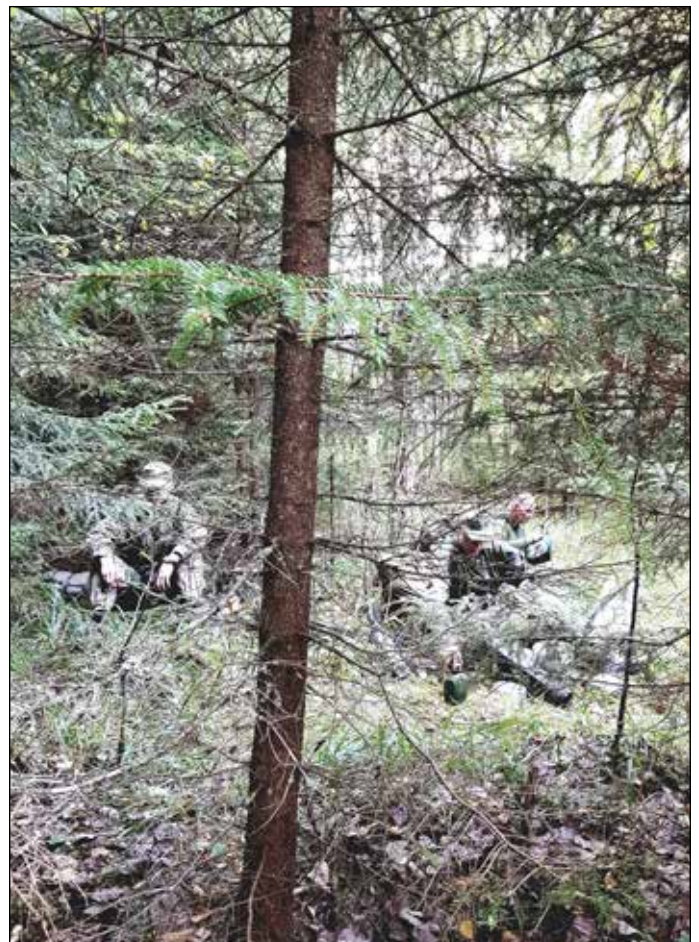
Metsänkätöksessä on rauhallista pitää taukoa.