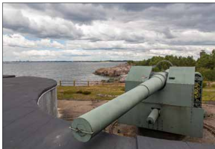
Kuivasaaren isoimmat tykit ovat todella kunnioitusta herättävän isoja.

vesilaukaus oli kevyempi ja ruudin roipheet paloivat vielä tullessa ulos putkesta.