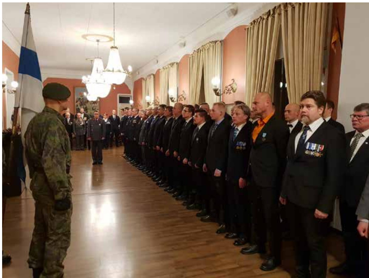
Palkittavat ja ylennettävät kunnioittivat lippuvartiota.

Kun kunniaavartion kuljettama kielekkeinen Suomen lippu oli saatettu asianmukaisella kunnioituksella pois juhlatilasta, oli aika siirtyä juhlakahveille. Iloinen puheensorina sekä Itsenäisyyspäivän aaton ja Itsenäisyyspäivän juhlaan valmistautumisen tunnelma loi oman, juhlanan henkensä kahvitilaisuudelle. Tilaisuus on jokaiselle osallistujalle sellainen, joka säilyy muistoissa pitkään eikä haalistu.