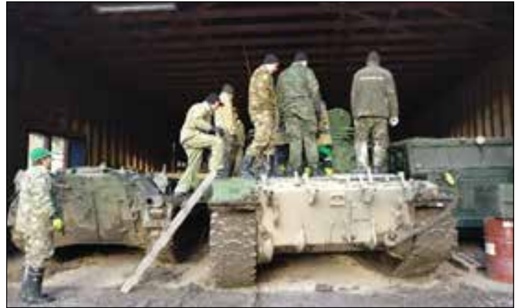
Tutustutaan T-55 panssarivaunuun