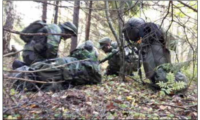
Tiedustelupartio saa tehtävän.