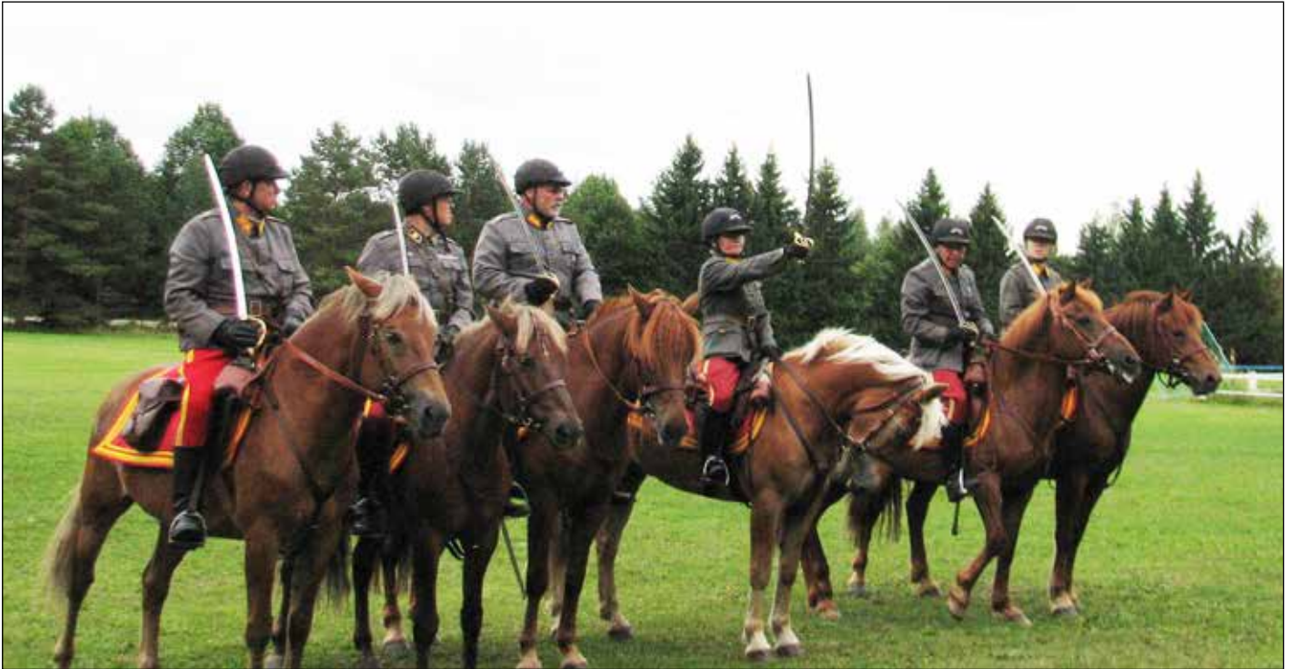
Ojennus!, kuului komento. Ratsumieskillan Lahden Eskadroona ratsuosasto esitti mallikkaasti ratsuväen 1930-luvun sulkeisjärjestystä. Asusteet ja varusteet olivat ajanmukaiset.