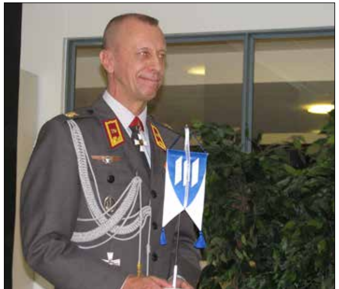
Prikaatinkenraali Rami Saari piti juhlamieltä nostattavan tervehdyspuheen sekä vastaanotti ilmeisen tyytyväisenä MPK:n Lahden Koulutuspaikan standaarin.