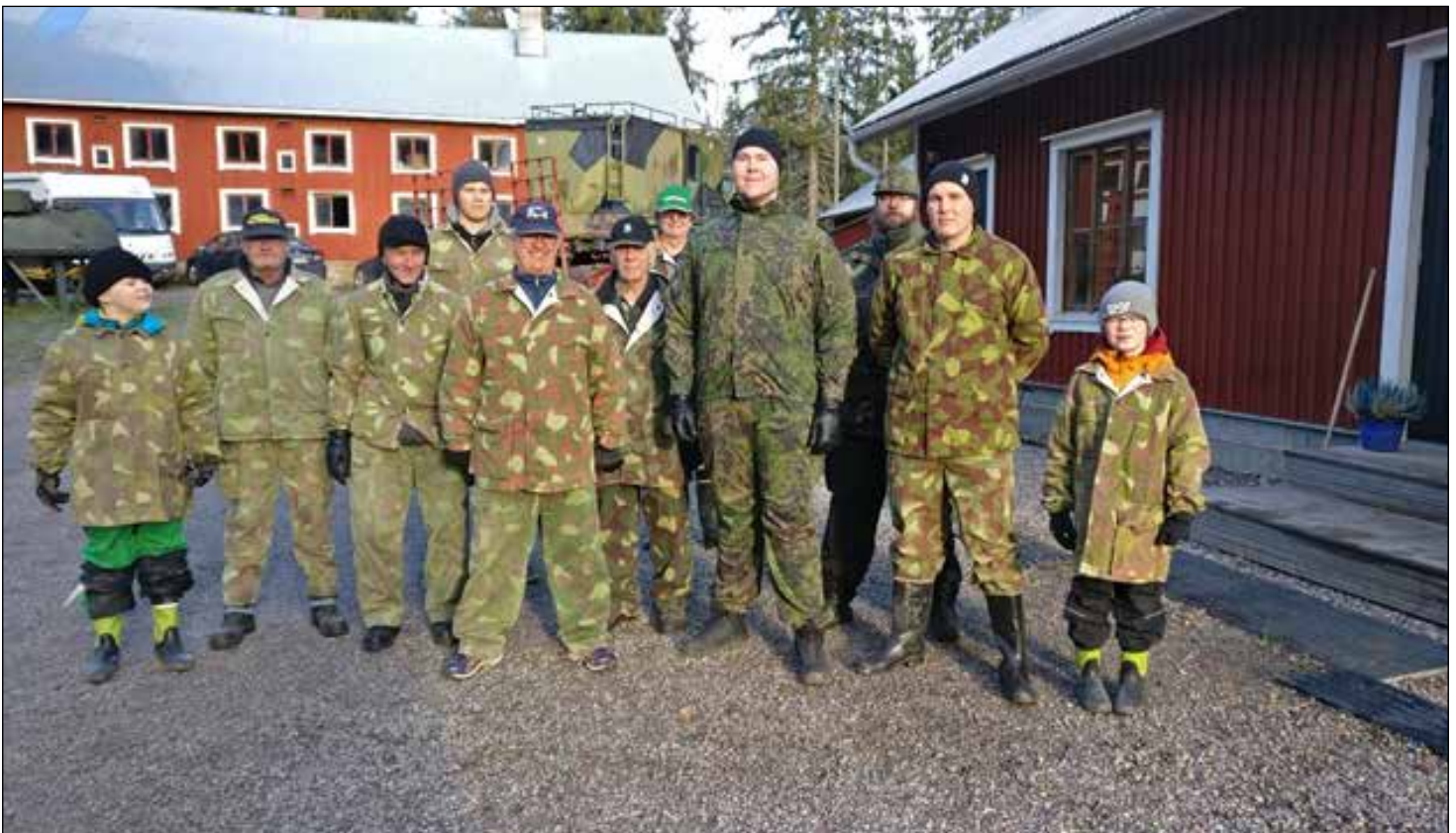
Yhteispotretti. Nuorin joukosta oli vasta 8-vuotias – ja ajoi itse myös vaunulla!