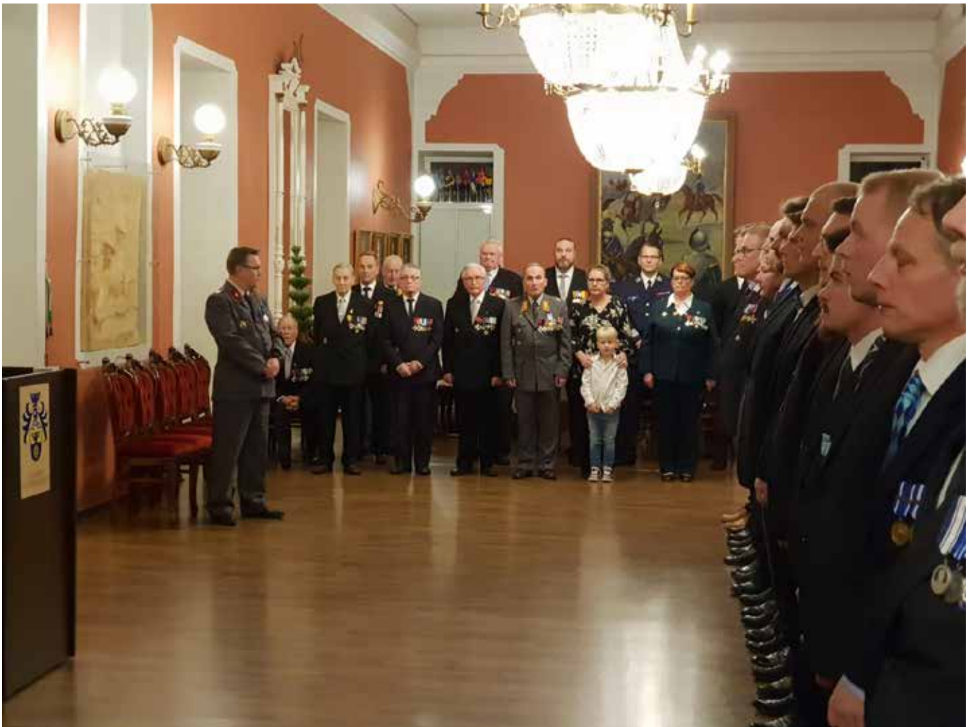
Arvovaltainen kutsuvierasjoukko sotaveteraanien johdolla valvoi tarkasti ylennettävien ja palkittavien rivistöä.