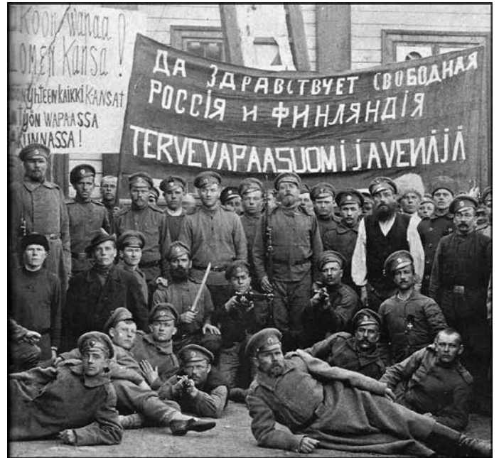
Venäläisiä sotilaita ja suomalaisia yhteiskuvassa 1917. Marraskuun vallankaappauksen jälkeen Pietarin bolsevikkien kiihotustoiminta voimistui Suomessa.

Itsenäisyyden tunnustamisesta huolimatta Leninin hallitus ei ollut vetänyt sotilaitaan pois Suomesta. Maassa oli ainakin 75 000 sotilasta (lukumäärä epäselvä), ja Venäjällä vallassa olivat bolsevikit. Syksyllä 1917 venäläisissä joukko-osastoissa todellista valtaa pitivät sotilasneuvostot. Bolsevikit saivat määräysvalan Suomen alueen sotilaiden ja työläisten neuvostossa, jonka johtoon valittiin latvialaissyntyinen Ivar Smilga. Bolsevikki Smilga tuki aktiivisesti sosialidemokraattien radikaalisiiven valmistelemaa vallankumousta. Punaisten kapinan valmistelu perustui avoimesti venäläiseen sotaväkeen ja sen aseisiin. Kysymys ei enää ollut Suomen porvarien ja työläisten välisestä luokkasodasta vaan kansainvälisen yhteiskunnallisen vallankumouksen toimeenpanemisesta, eikä enää