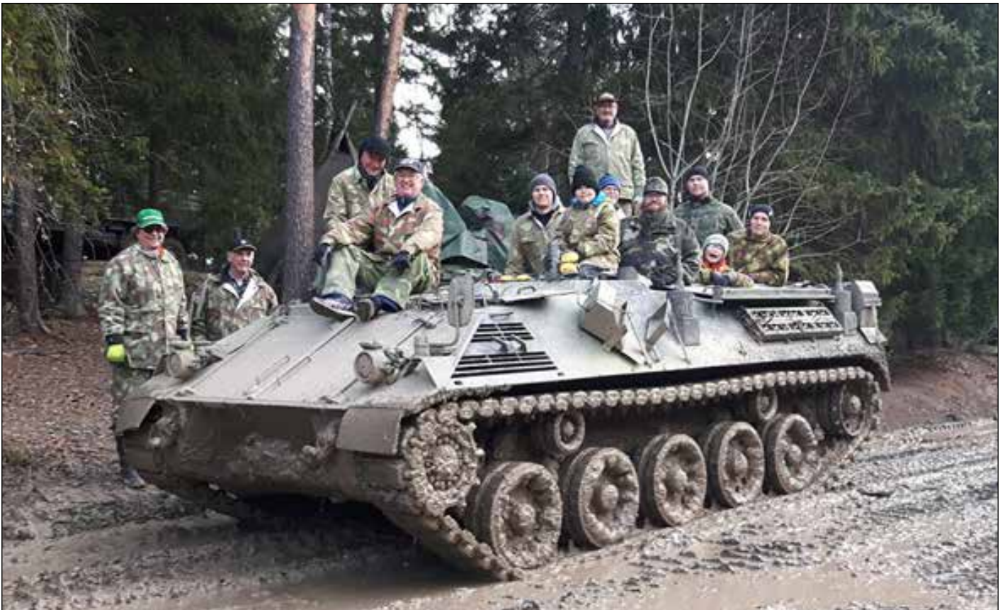
Iloinen joukko reserviläisiä ystävineen Saurerin kyydissä aurinkoisena syyspäivänä

Museokierroksen jälkeen siirryttiin valitsemaamme Saurer-panssarilla ja Zil-maastokuorma-autolla varsinaiselle safarille l. ajouralle, jossa jokaisella