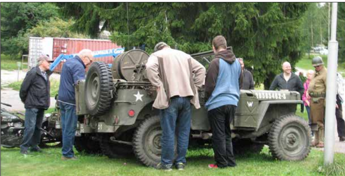
Sotahistoria kiinnosti kävijöitä. Esillä oli mm. toisen maailmansodan aikaisia jenkijeeppettä ja Panssarikillan entisöimä T26-panssarivaunu.