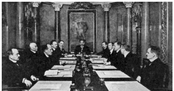
Suomen itsenäisyydestä. Eduskunta hyväksyi 6.12. senaatin toimet itsenäisyyden toteuttamiseksi. Vastoin Svinhufvudin odotuksia itsenäisyyspäiväksi tuli 6.12. eikä senaatin julistuksen päivämäärä 4.12.