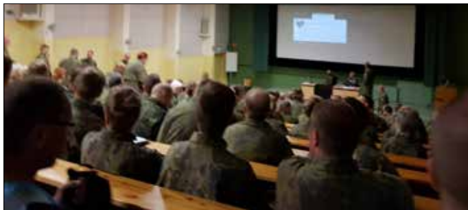
Harjoituksen liittyvät ohjeet on hyvä kuunnella tarkasti

Hattulan koulutuspaikka järjesti Hämeen Ilves 2018 -harjoituksen 21.–23.9. Panssariprikaatissa Parolassa. Kyseessä oli Hämeen maanpuolustuspiirin tämän vuoden tärkein harjoitus. Harjoitukseen osallis-