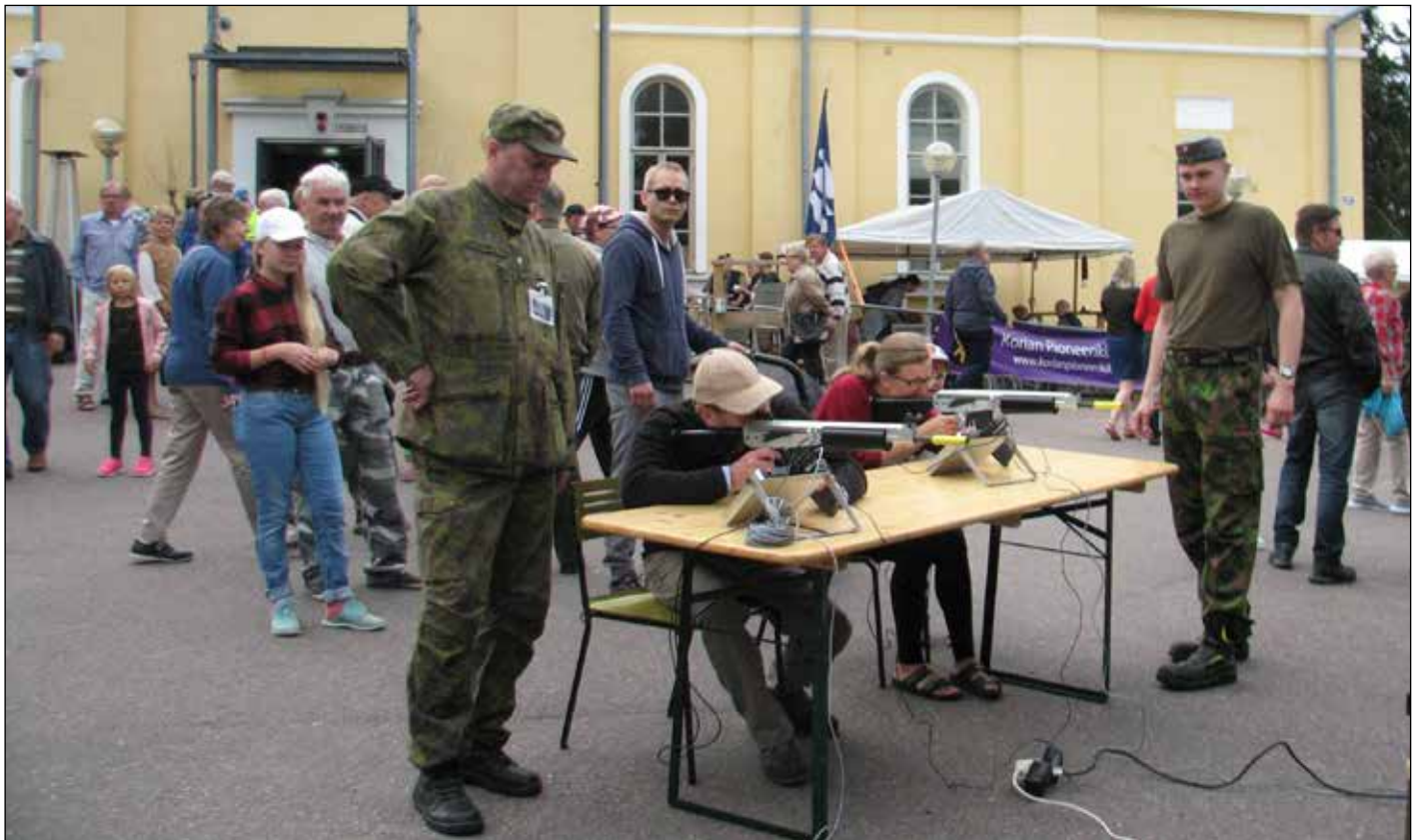
MPK:n laserammuntapisteellä riitti kävijöitä tasaisena virtana koko päivän ajan.