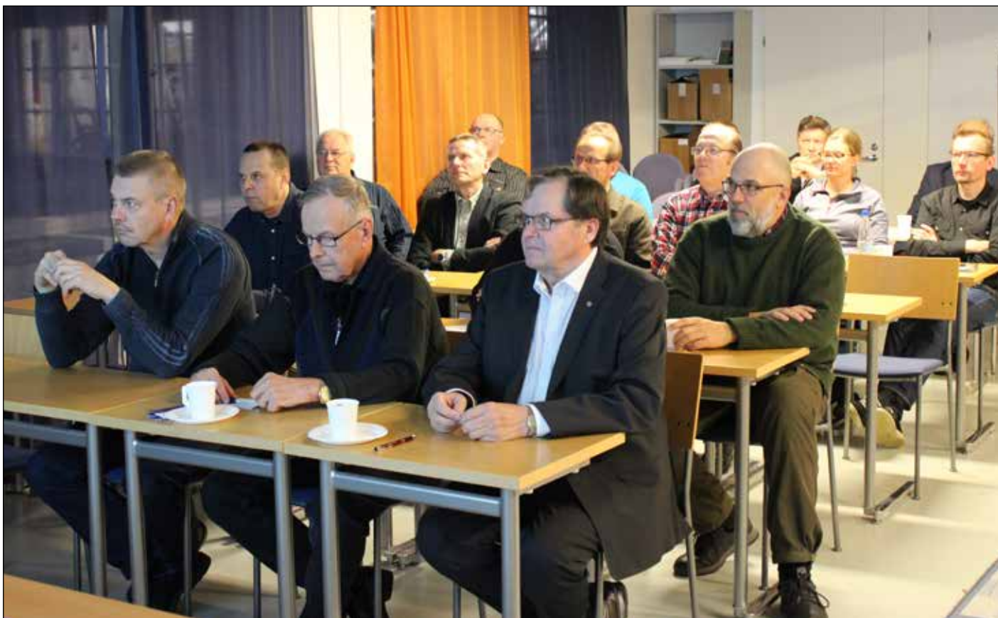
Maanpuolustustalon isompi kokoushuone oli piirin syyskokouksen näyttämönä.