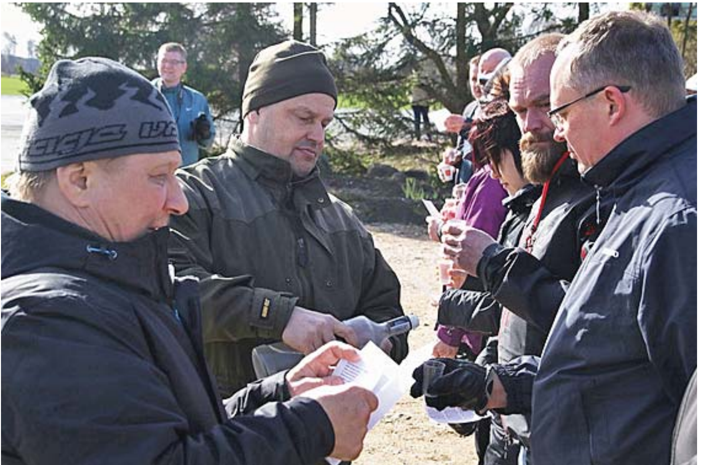
Sotahistoriamatkojen kohokohta on hiljentyminen ja kunniamaljan nosto merkittävässä kohteessa, nyt Schmardenissa