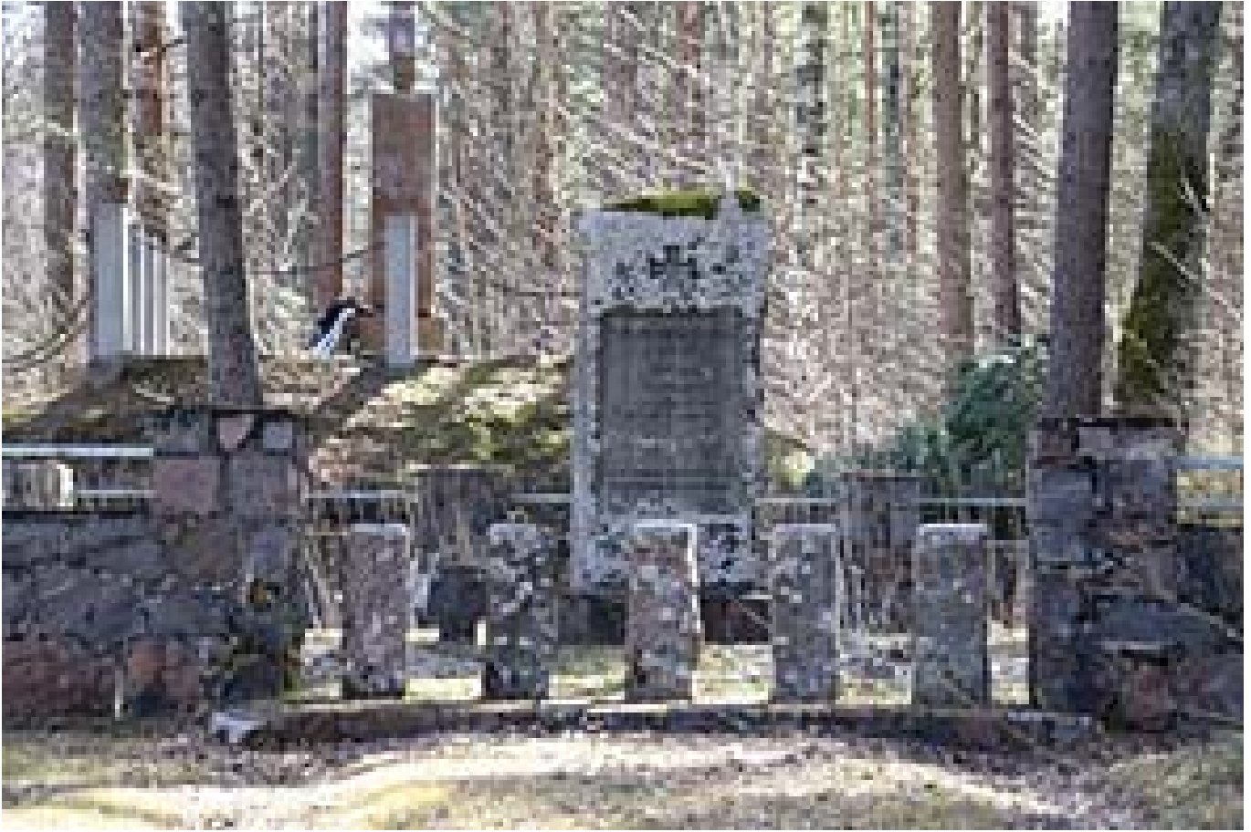
Matkan ehkä liikuttavin kohde oli neuvostomiehityksessä säilynyt entinen Gallingin (nyk. Bitite) hautausmaa.