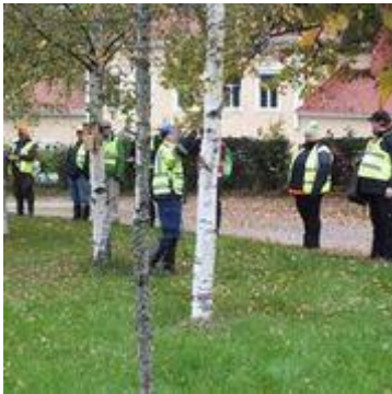
Ryhmä järjestäytyy kuulotuntuma haravointii. Etsittävä haluaa tulla löydetyksi

Partioetsintäpartioon ei mielellään sijoiteta etsittävän henkilön lähiomaisia, tuttuja eikä ensikertalaisia.