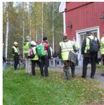
Perus käskynjako. Etsintään valmis joukko Nynäsin pihassa.