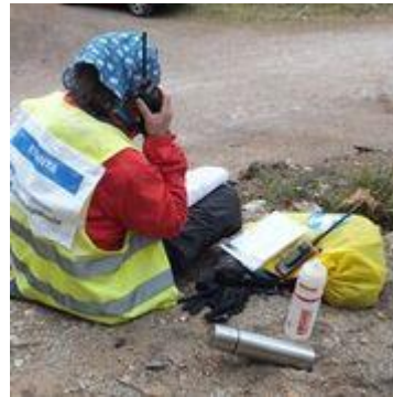
Viestin tärkeyttä ei voida sivuuttaa.