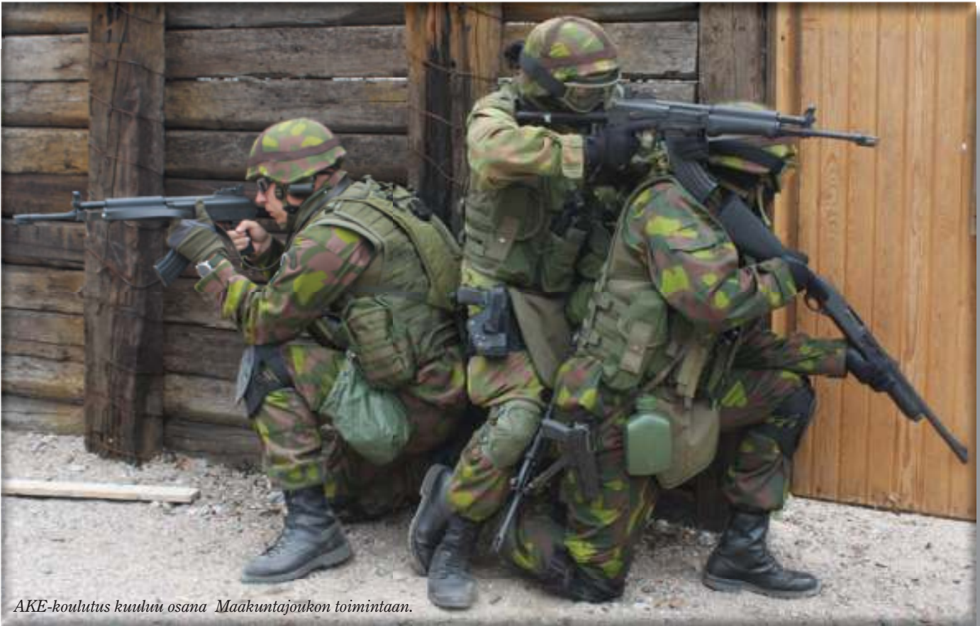
AKE-koulutus kuuluu osana Maakuntajoukon toimintaan.