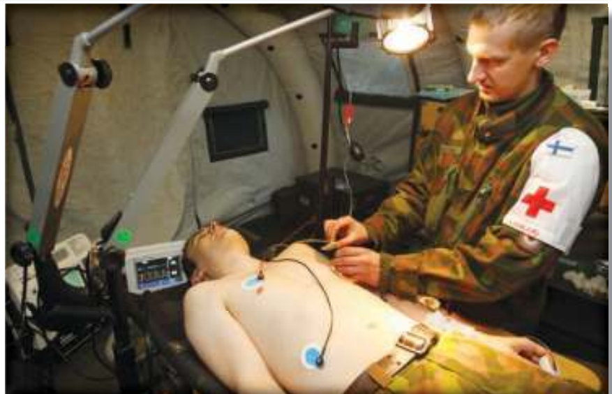
Sotilaslääketieteen Keskuksen johto ja esikunta sijaitsevat Lahdessa s. 6-7