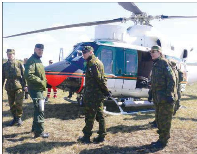
Koulutustoimintaa eri viranomais- tahojen kanssa.

Varusmieskoulutuksen tavoitteena on sotakelpoisen joukon luominen. Tähän nykyinenkin varusmiesten joukkotuotanto tähtää. Sotakelpoinen joukko keskittyy siis paljolti toimimaan sodan aikana. Päijät-Hämeen Maakuntakomppanian pitää pystyä toimimaan kaikissa valmiuden vaiheissa, niin rauhan aikana muiden viranomaisten tukemisessa kuin mahdollista kriisiä edeltävässä vaiheessa ja totta kai myös sodan aikana. Tämä laaja-alainen toiminta-