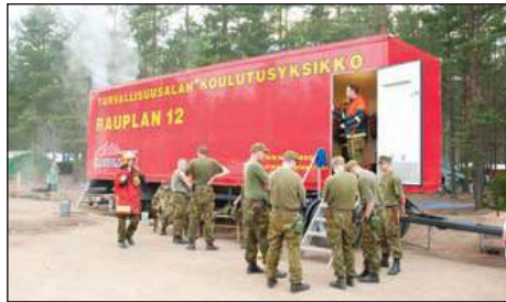
Alakuva: yhteistyötä Palotarun 2010 suurleirillä.

tyspiirteitä ovat hyvä liikkumiskyky, hyvä paikallistuntemus sekä kyky reagoida nopeasti muuttuviin tilanteisiin.