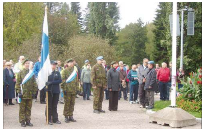
Kuoron käskyhaltijan iloa kun saa kuorokillit johdettua veteraanikävelyllä maaliin.