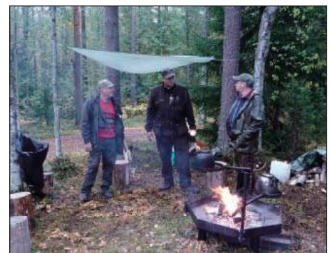
Metsästysseuran rastilla nokipannukahvin keitossa