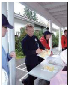
Lähtö ja reitille opastus