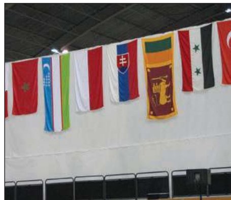
Sotilaiden MM-painit elokuussa olivat iso, kansainvälinen tapahtuma. Osanottajamaiden lippujen kirjo kertoi osaltaan lajin levinneisyydestä maailmalla.