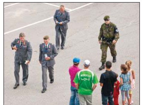
Sotilaiden MM-paini oli näytön paikka komppanialle.