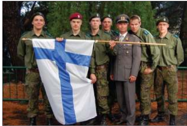
Suomen joukkue edusti hienosti.

Ensi keväänä AESOR-järjestön puheenjohtajuuden on tarkoitus siirtyä Espanjaan. Siirtoa mutkistaa kuitenkin Espanjan puolustusministeriön tuore päätös yhdistää siellä toimivat reservialiupeeri- ja upseerijärjestöt. Monille AESOR:n vanhoille jäsenmaille näin läheinen yhteistyön upseerien kanssa on vaikeaa. Myös Reserviläisliitto on ajoittain törmännyt tähän vastakkainasetteluun, koska liiton kilpailujoukkueissa on usein ollut myös upseereita. Ikävin tilanne syntyi Italian kisassa, jossa ollemmat suomalaisjoukkueet sysättiin kilpailun jälkeen tehdyllä päätöksellä vierasjoukkuekategoriaan. Näin parhaan joukkueen pokaali voitiin palkintojenjaossa ojentaa pisteissä toiseksi tulleelle Ranskan nelosjoukkueelle, johon kuului vain aliupeereita. Seuraava AESOR-jär-