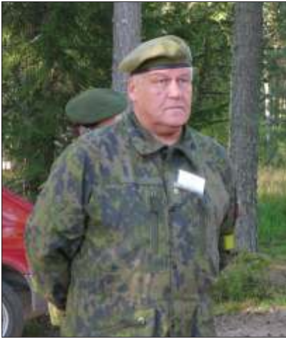
Kilpailujen suojelija kenraalimajuri Kari Siiki.

Orimattilan reserviläiset tuki-joukkoineen vastasivat Reserviläisliiton ampumamestaruuskilpailujen järjestelyistä Hälvälän ampumaurheilukeskuksen radoilla. Neljän kuukauden työrupeama tiivistyi vaihtelevan au-