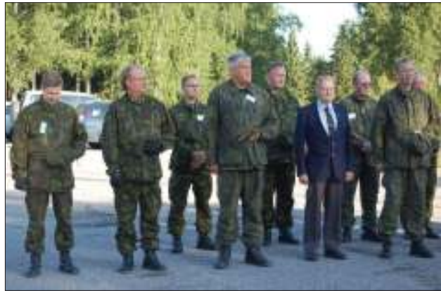
Joukot järjestäytyneet avajaisiin.