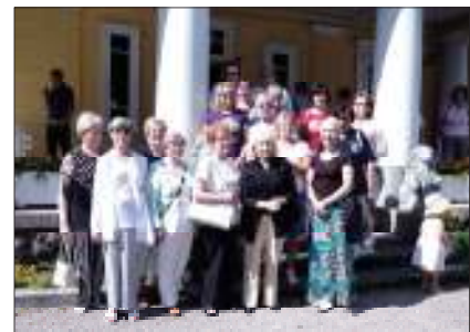
Kaisankodin edessä Espoon -, Kärkölän - ja Lahden Maanpuolustusnaiset

JO YLI 50 VUODEN AJAN OLEMME KERTONEET KAIKEN KUKKASIN