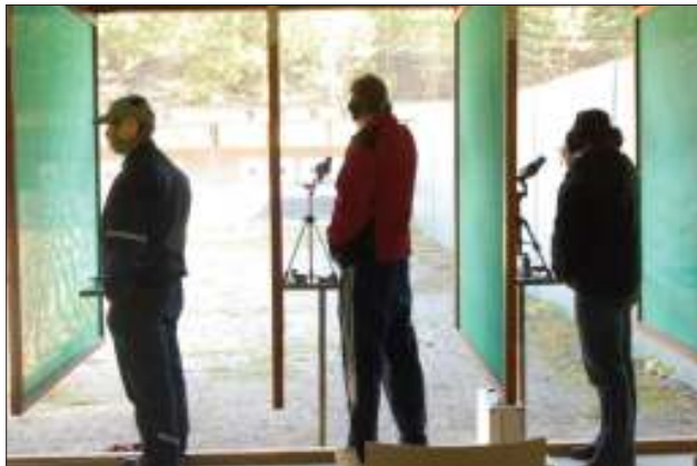
Suoritus menossa.

levi Laajapuro, kentän Heimo Lahtinen ja RA:n Marko Patrakka sekä kilpailukanslian toiminnasta ja tulospalvelusta Jarmo Mäkinen. Kiitos vielä kerran kaikille toimit-