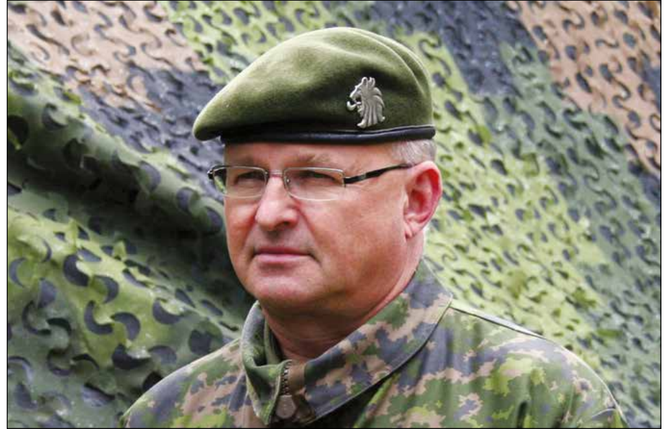
Prikaatikenraali Pertti Laatikainen.

luttajista tulee Reserviläisliiton riveistä.