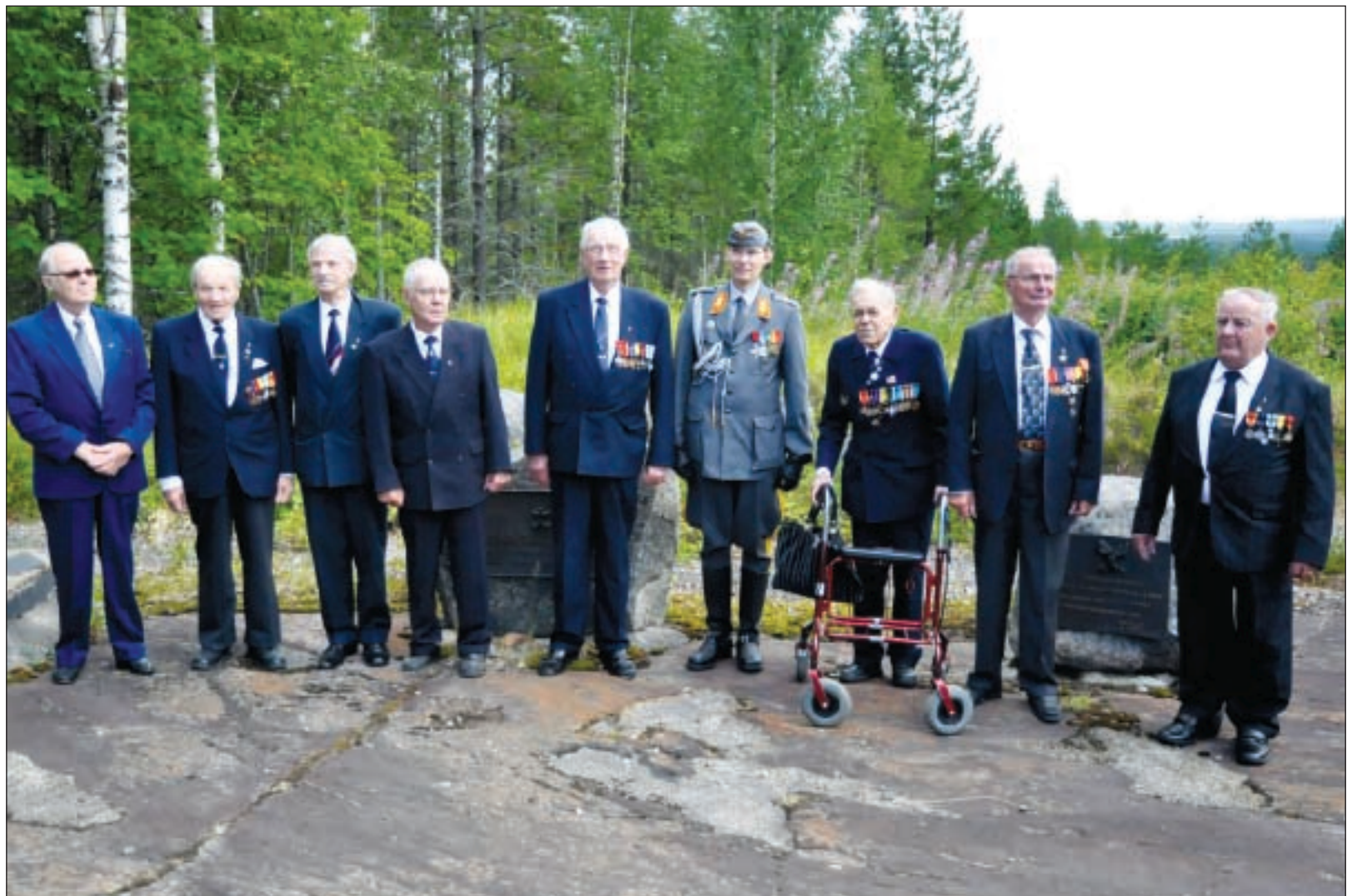
Ilomantsin taistelujen sotaveteraanit ja Hämeen Ratsujääkäripataljoonan komentaja

Hämeen Ratsujääkäripataljoonan päällikkö