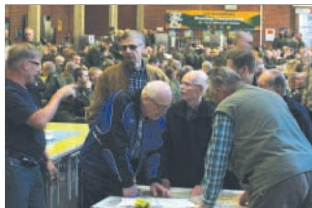
Veteraanipäivän keräys.