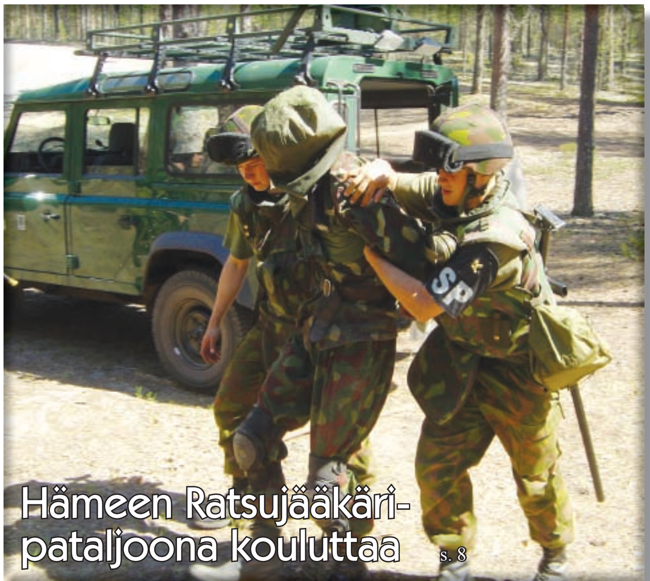
Hämeen Ratsujääkäripataljoona kouluttaa s. 8