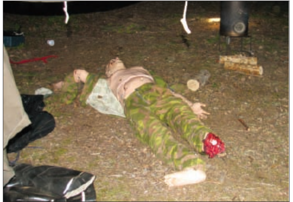
Simulaattorinukke odottaa vuoroaan. Varsin aidon näköisellä ja hyvin aidosti "sairastavalla" nukella on hintaa parin perheauton verran.