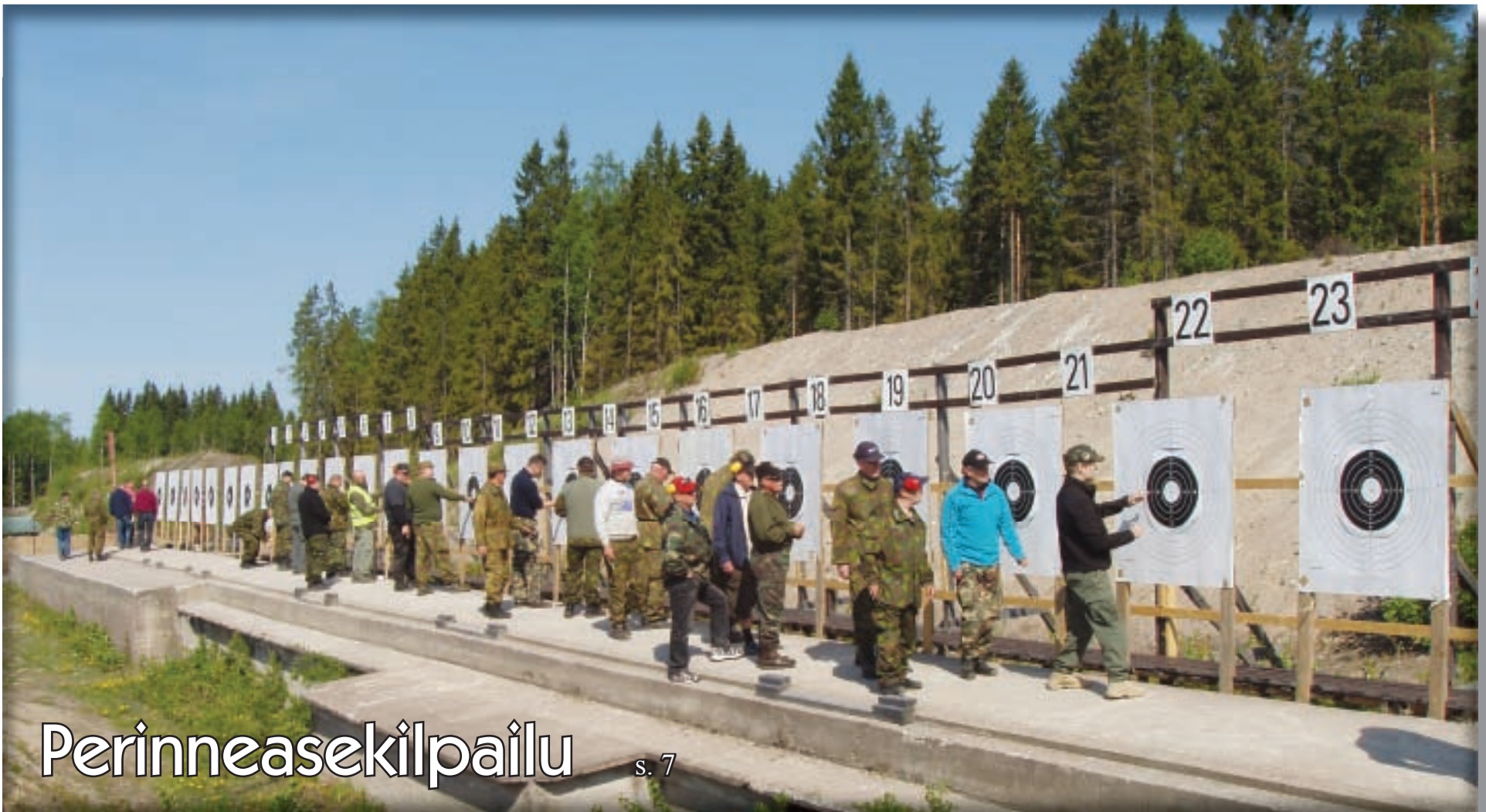
Perinneasekilpailu s. 7

Päijät-Hämeen Reservipiiri ry:n tiedotuslehti 2/2011