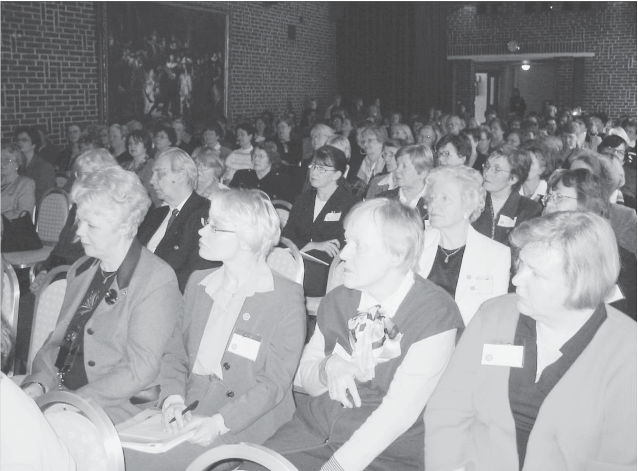
Vanajanlinnan juhlasali täyttyi kokous- ja seminaarin osanottajista ääriään myöten.

Suomen Maanpuolustusnaisten Liitto Ry ja Suomen Naisten Maanpuolustusjärjestö ry viettivät Hämeenlinnan Vanajanlinnassa kevätliittokokouksiaan ja yhteistä seminaaria 05.04.2003.