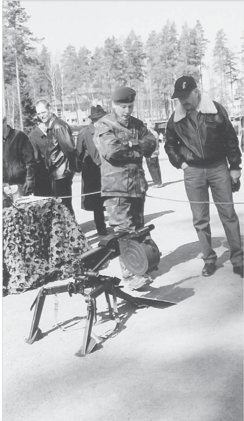
Kantahenkilökuntaan kuuluva yliil. esittelee kranaattikonekivääriä.