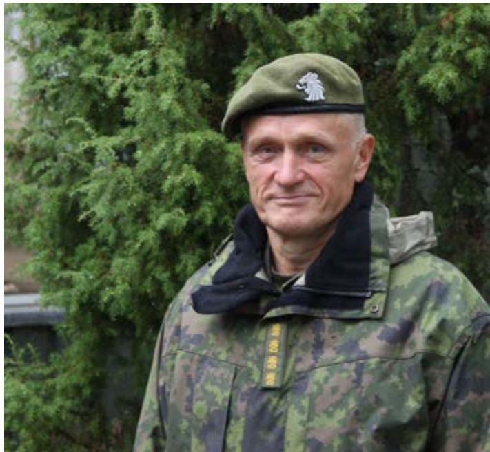
Kenraali Timo Kivinen kertoi kertausharjoitusmäärien lisääntyvän tänä vuonna.

Puolustusvoimat on viime vuodet panostanut paljon varusmieskoulutuksen kehittämiseen. Nyt olisi tarvetta suunnata voimavaroja myös reserviläisten koulutukseen, linjaa Puolustusvoimain komentaja, kenraali Timo Kivinen. Komentaja puhui aiheesta marraskuussa 2020 tervehdyksessään valtakunnallisen maanpuolustuskurssin avajaisissa.