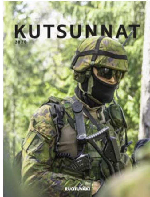
Kutsuntoihin tulevat miehet saivat tietoa armeijasta ja kutsunnoista mm. Ruotuväen kutsuntainfoliitteesta.

Vuosittain 15.8.–15.12. järjestettävät kutsunnat ovat Puolustusvoimille tärkeitä tilaisuuksia asevelvol-