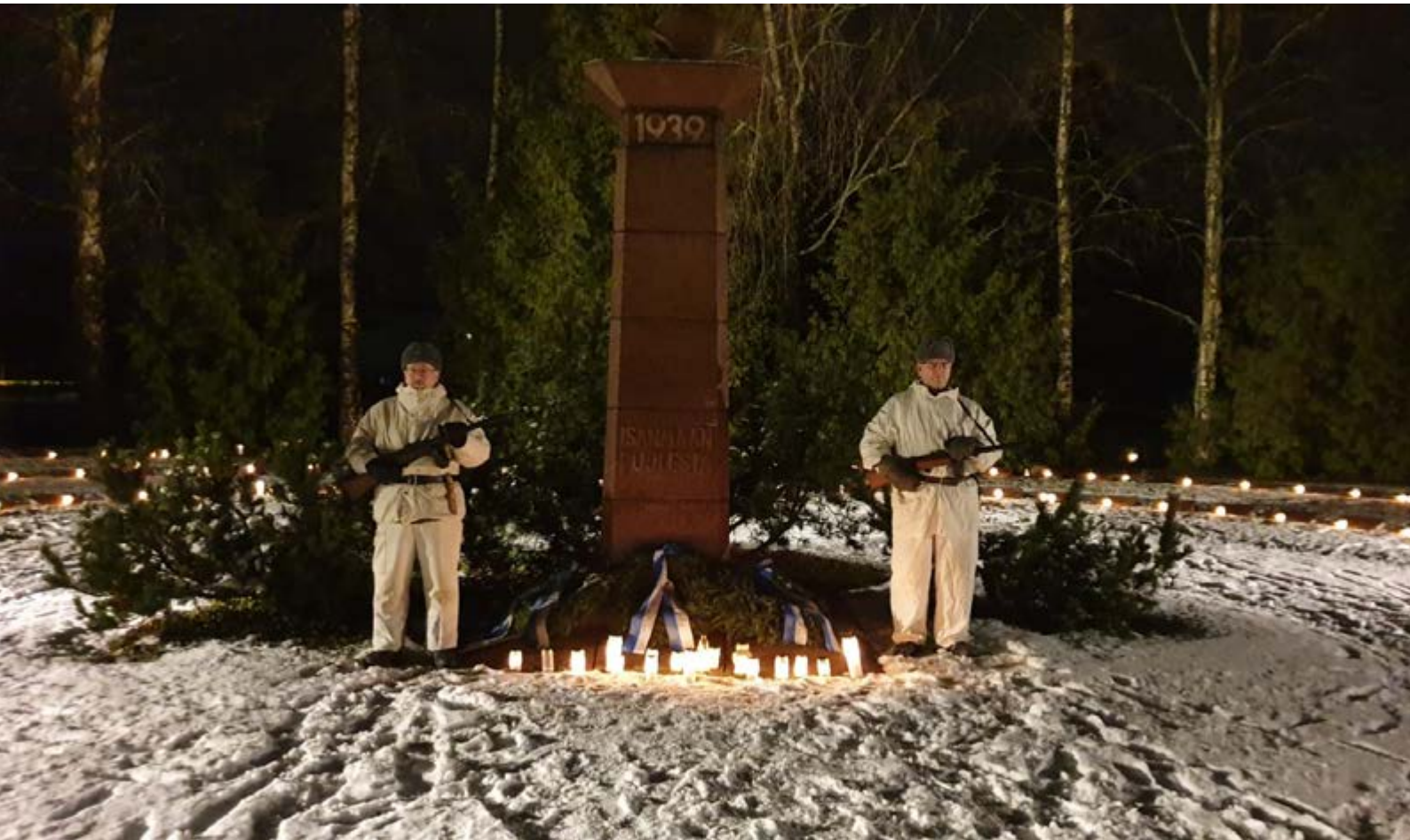
Jouluaaton kunniavartio Asikkalan sankarihaudoilla.

Päijät-Hämeen Reservipiiri ry:n tiedote 1/2021