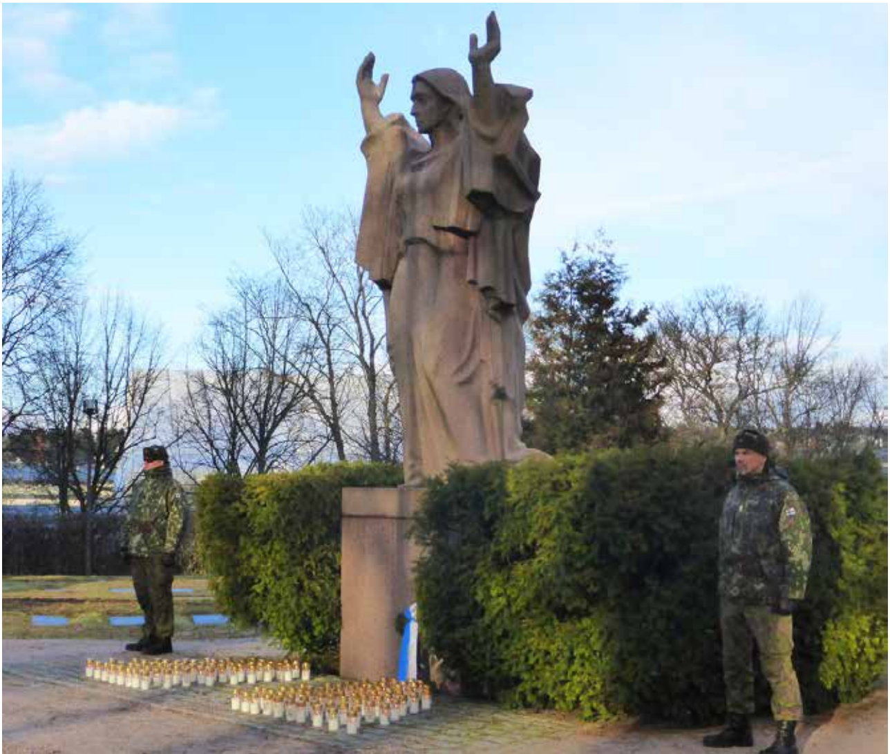
Talvisodan päättymistä kunnioitettiin 105 kynttilällä Lahden Ristinkirkon Vapauden hengetär -patsaan luona.

Päijät-Hämeen Reservipiiri ry:n tiedote 1/2020