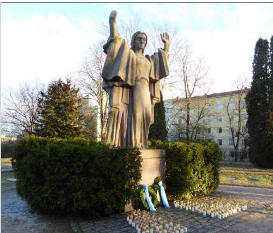
Wäinö Aaltosen veistos Vapauden hengetär on perinteisesti ollut talvisodan muistojuhlan keskushahmo.