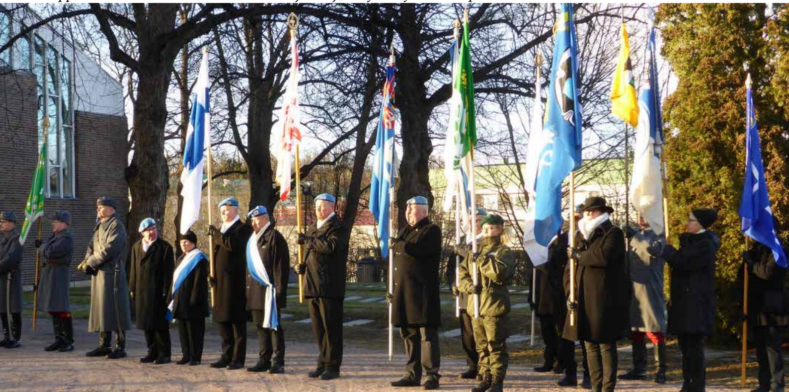
Lippulinnessa olivat veteraanien, reserviyhdistysten ja karjalaisten liput.