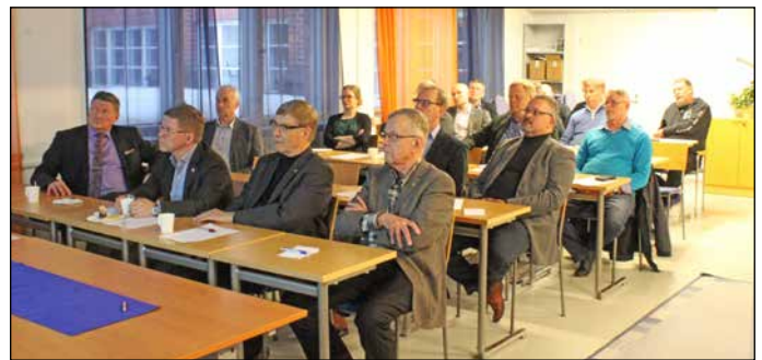
Piirin kevätkokoukseen osallistui hyvässä yhteishengessä 25 reserviläistä.