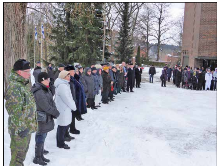
Vapaudenhenttären patsaalle oli kerääntynyt noin 250 henkilöä kunnioittamaan Talvisodassa uhrinsa antaneita.