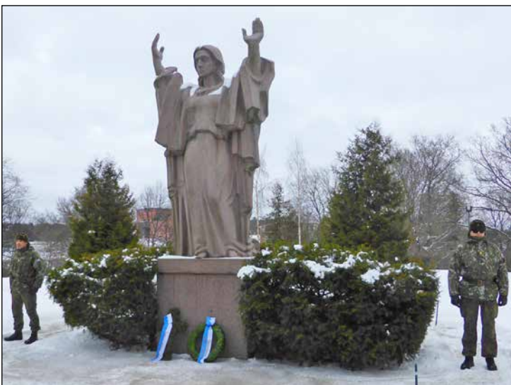
Seppelöity Vapaudenhenttär -patsas kunniavartiossa.