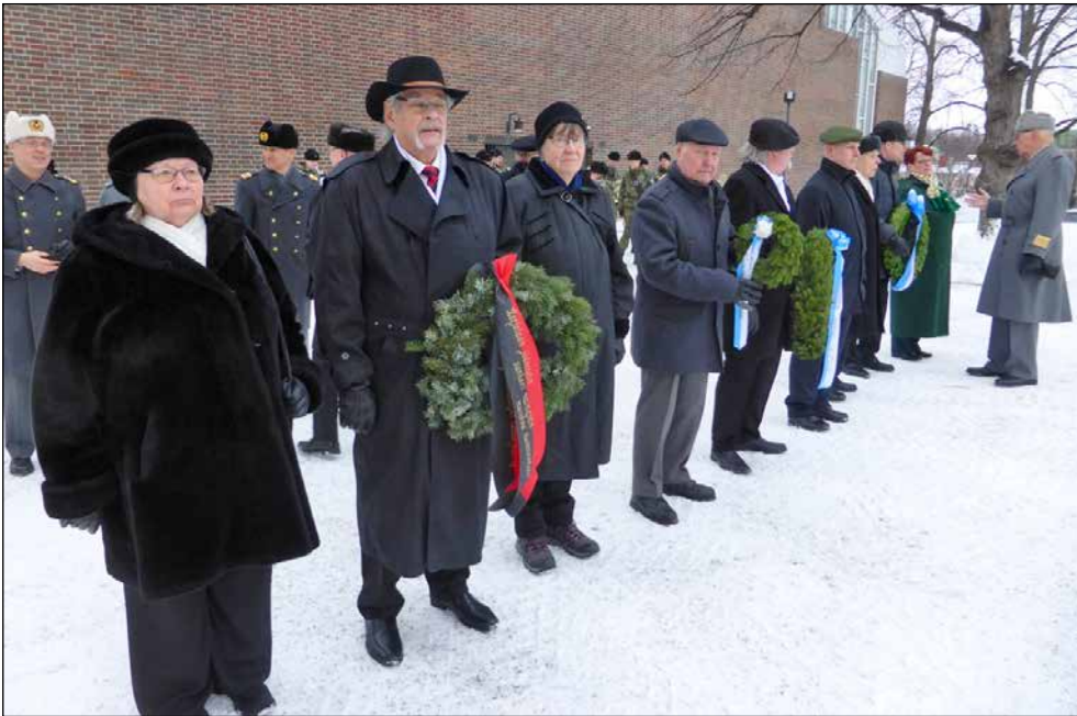
Seppelipartiot käskenjalla ja valmiina suorittamaan tehtävänsä.