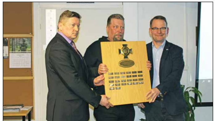
Vuoden 2018 reserviläisyhdistyksenä palkittiin Asikkalan reserviläiset.