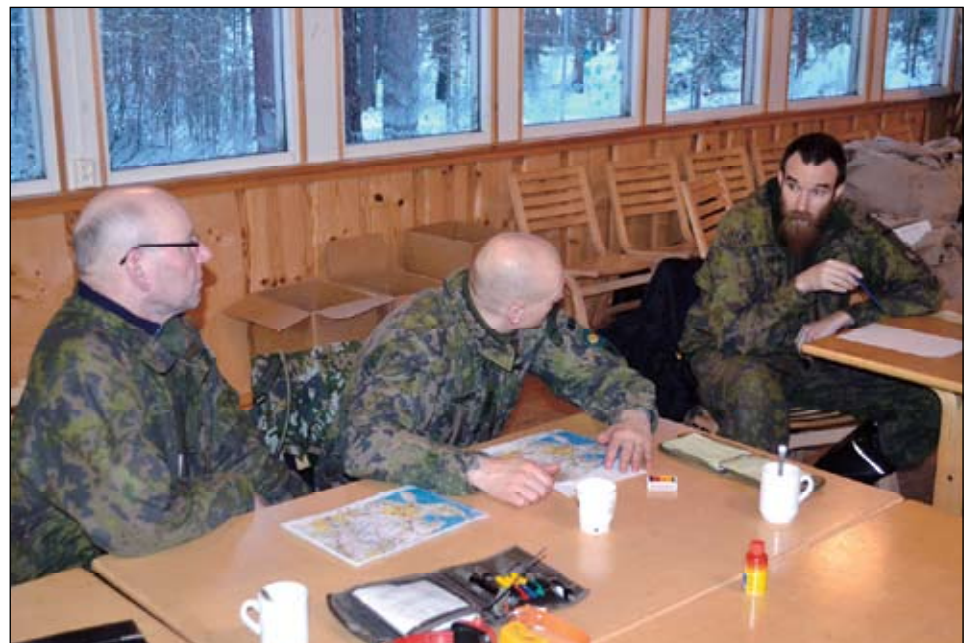
Harjoituksen terävintä johtoa.