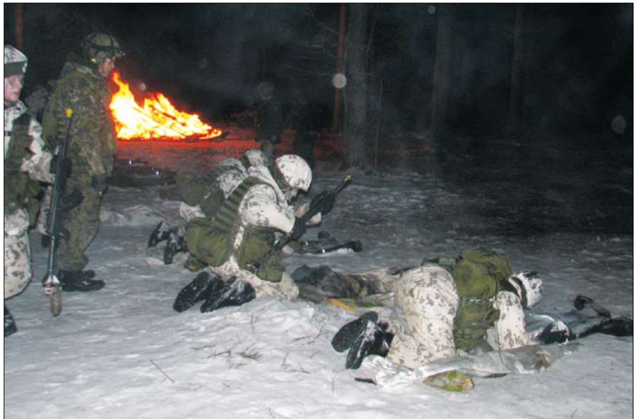
Alin kuva: Läpi liekkimeren!

Keskimmäinen kuva: Tulisyöksyn läpi kiirehdyttiin sammuttamaan taistelutovereita, jotka olivat saaneet liekehtivän napalm-tartunnan.