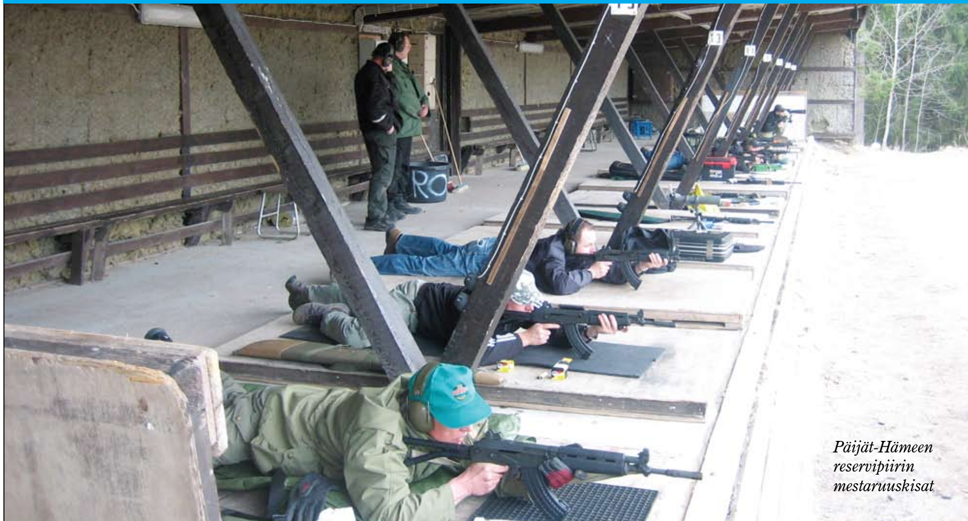
Päijät-Hämeen reservipiirin mestaruuskisat

Päijät-Hämeen Reservipiiri ry:n tiedotuslehti 1/2014