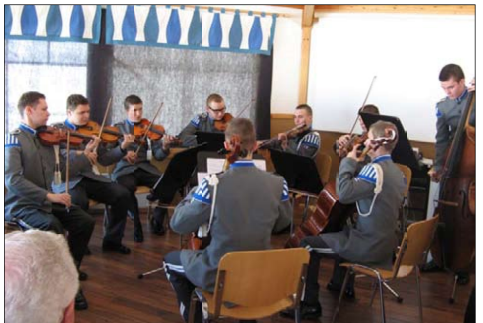
Juhlamusiikista vastasi Varusmiessoittokunnan jousiyhtye johtajanaan yliluutnantti