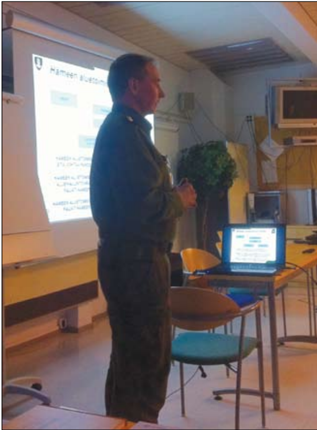
Panssariprikaatin komentaja Pekka Toveri