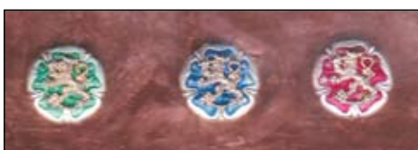
Pinssejä vihreä, sininen ja punainen

Tässä yhdistykset voivat tehdä myös varainhankintaa. Merkki ohjeistetaan luovuttamaan uudelle jäsenelle yhdistyksen kokouksissa kunniakirjan ja esimerkiksi yhdistyksen toimintakalenterin kanssa. Näin uusi jäsen aktivoituu ja sitoutetaan paremmin jäsenyyteen.