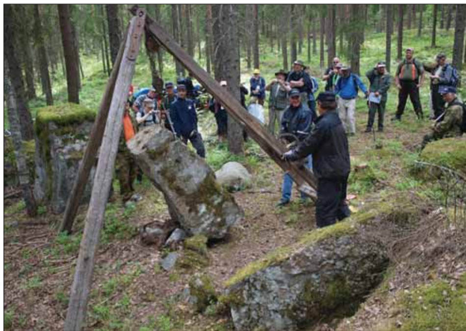
Luumäen linjan –reitin vaeltajille näytettiin viime vuoden Salpavaelluksessa kuinka estekivi nousee kolmijalalla.

Maalta merelle –reitin vaeltajat tutustuivat viime vuonna keskeneräiseen korsukuoppaan Miehikkälässä.