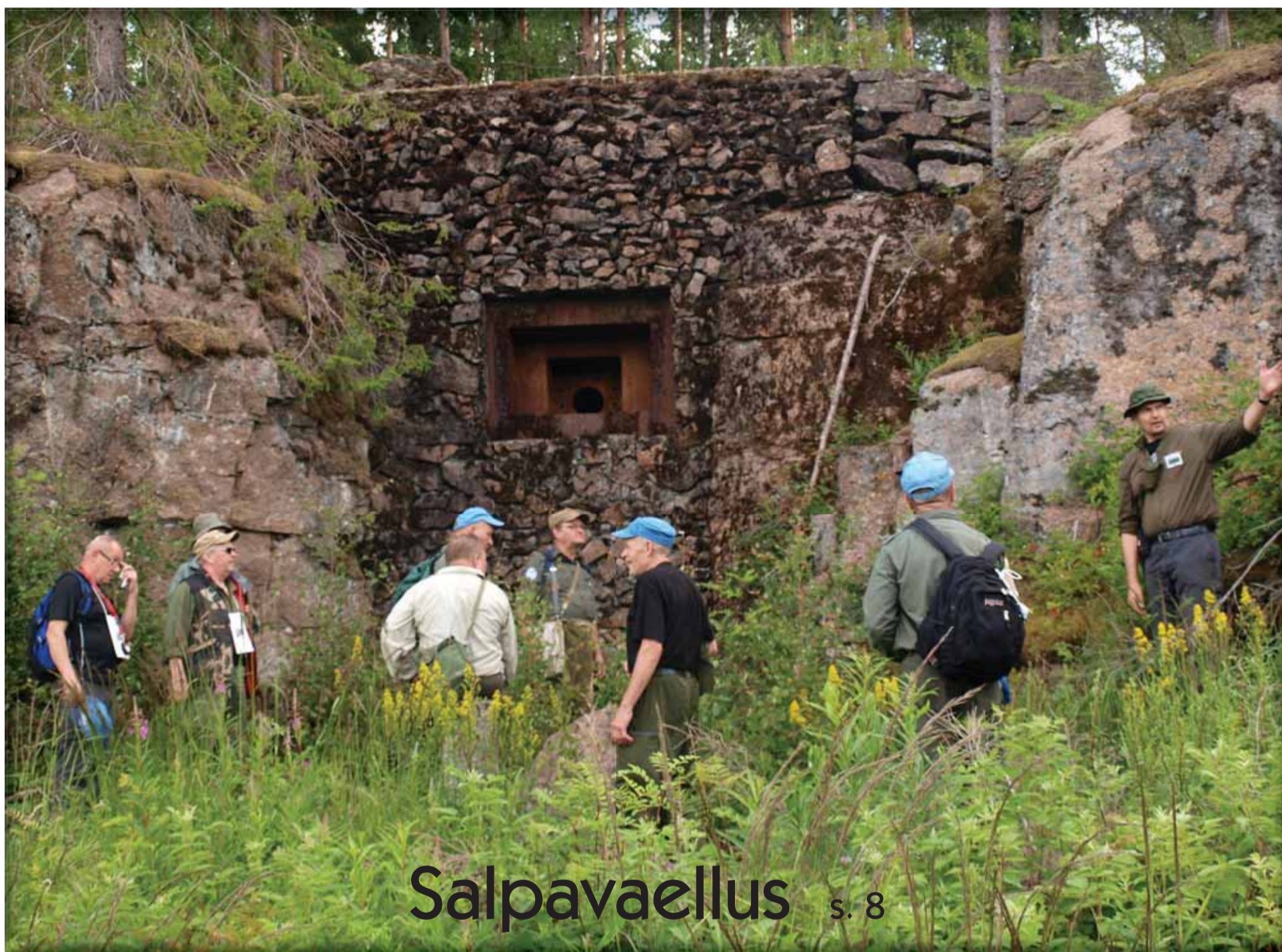
Salpavaellus s. 8

Päijät-Hämeen Reservipiiri ry:n tiedotuslehti 4/2012