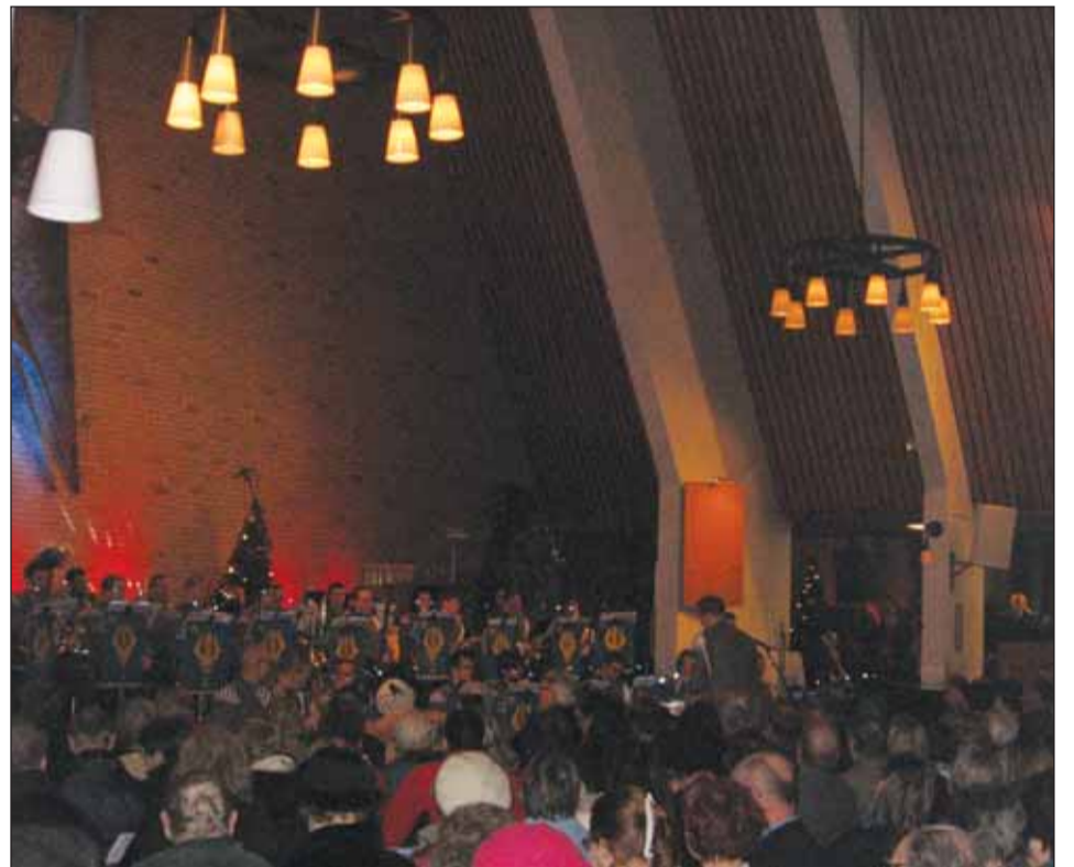
Joulukonsertti veti Lahden Joutjärven kirkkoon peräti reilut 800 kuulijaa.