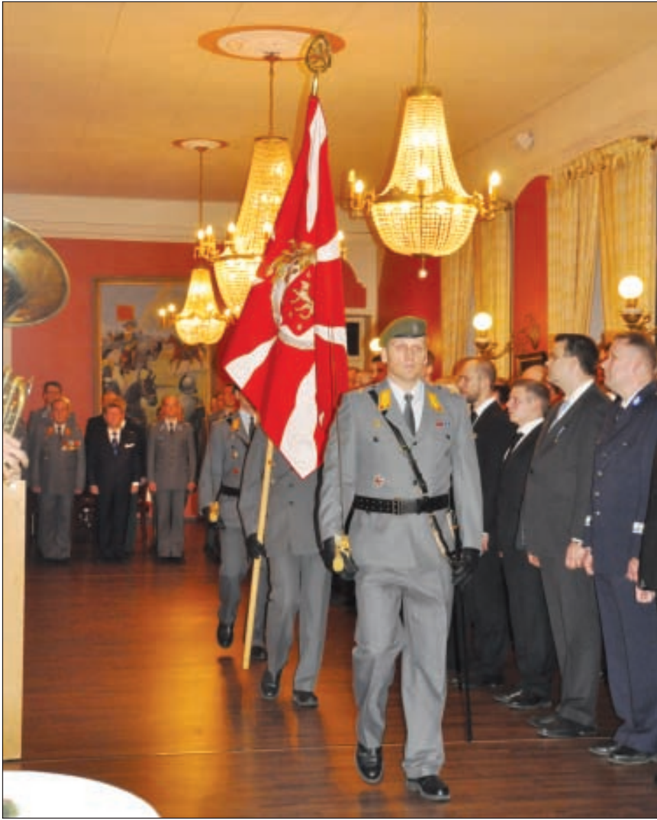
Hämeen Rykmentin lippu saapuu.