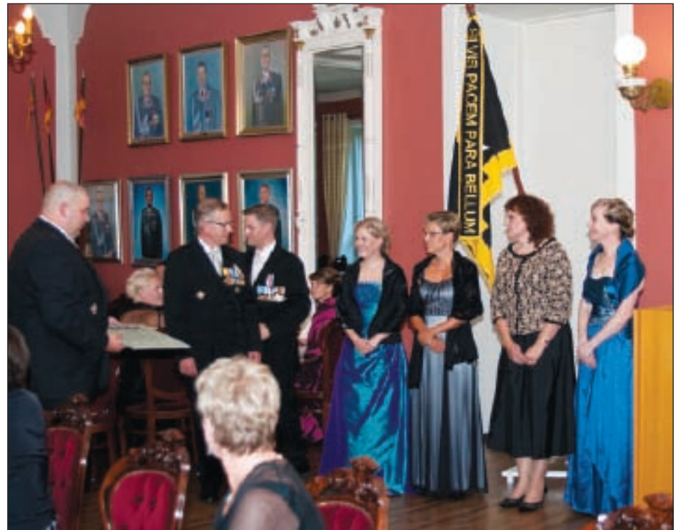
Myös naiset palkittiin huomionosoituksin.