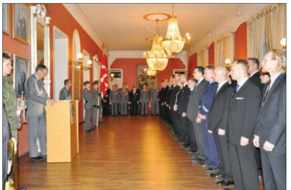
Ylennetyt ja palkitut järjestäytyneenä upseerikerholla.