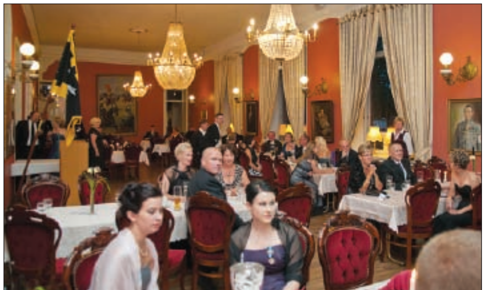
Upseerikerho loi jälleen upeat puitteet onnistullelle juhalle.