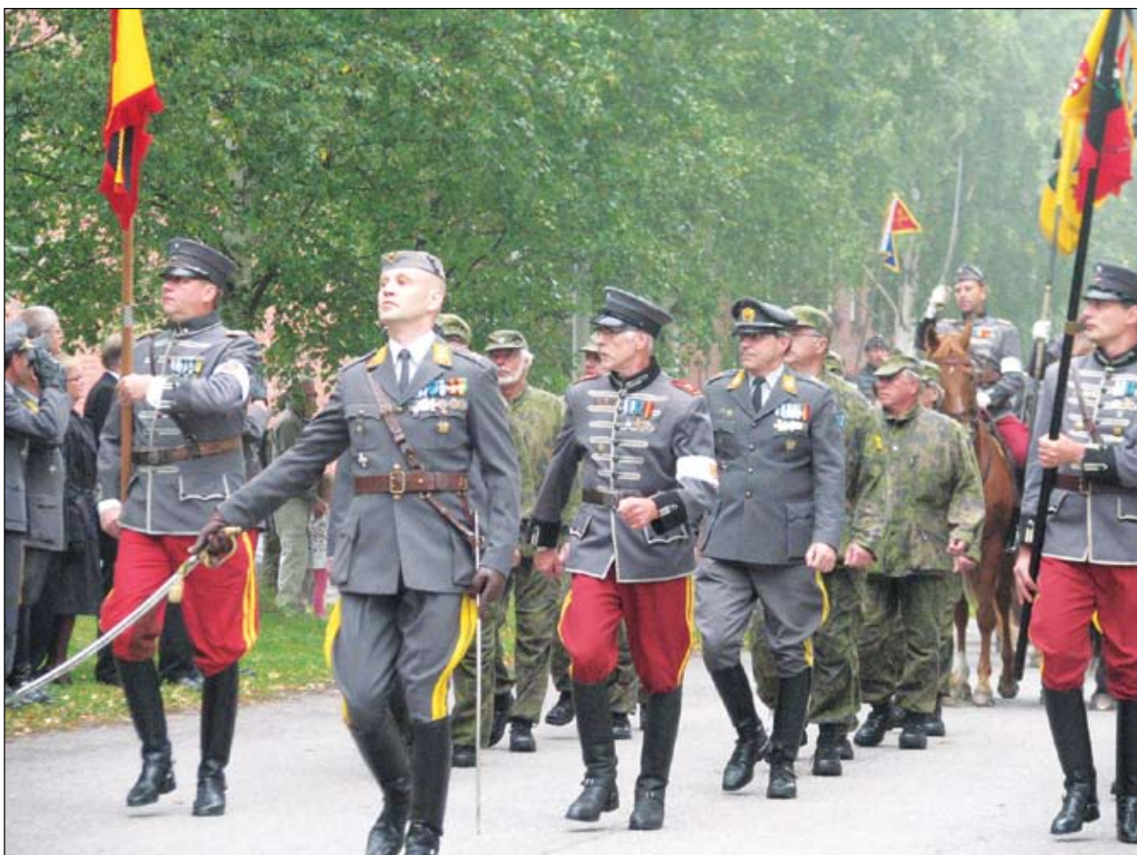
Ratsain tai jalan, kunniamme on sama!

Perjantain kuudes syyskuuta aamu Lahden Hennalassa oli niin harmaa ja sumuinen, että sen sitä olisi voinut leikata vaikka sapelilla. Ja niin siinä kävikin. Varuskunnan keskeisellä Lippukentällä nähtiin vauhdikas atakki, jossa sapeli viuhuivat ja "HAKKAA PÄÄLLE" raikui. Hämeen Ratsujääkäripataljoonan ja Ratsumieskillan perinnepäivän paraati oli saanut arvoisensa lopun.