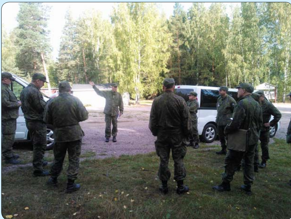
Esikuntatyöskentely-kurssin toinen jakso pidettiin Hollolan Hälvälässä.