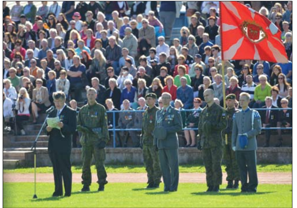
Paikalle oli saapunut runsaasti varusmiesten omaisia.

Virren sanat oli harjoiteltu valatilaisuutta varten.