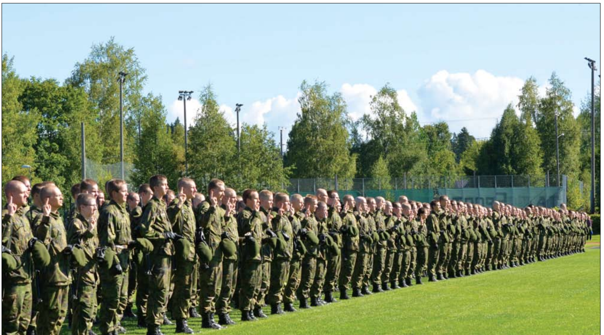
Hämeen Rykmentin sotilasvala oli viimeistä kertaa Kärkölässä.