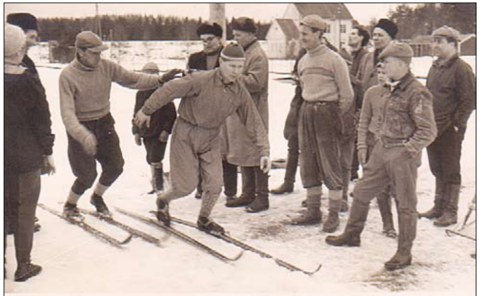
Kuva on otettu vuonna 1961 kotikylän hiihtokisoissa Myllykylän koulun pihapiirissä.