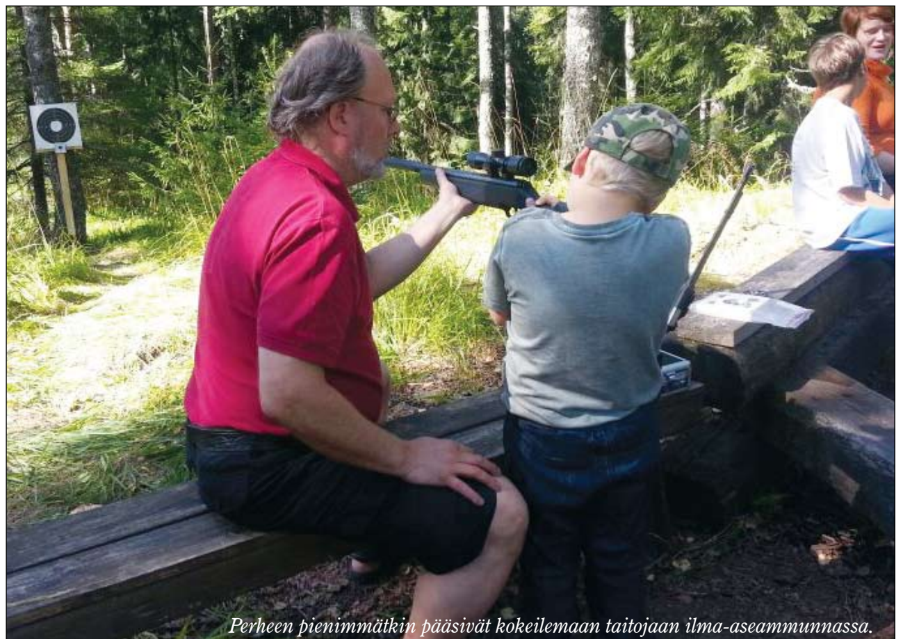
Perheen pienimmätkin pääsivät kokeilemaan taitojaan ilma-aseammunnassa.

Hälvälässä on tällaiseenkin toimintaan erinomaiset puitteet. Ensivuonna laajennamme ampumapäivän tarjontaa.