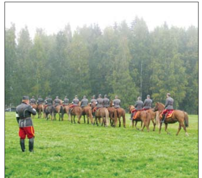
Perinneasuin varustautunut 19 ratsukon osasto antoi Lippukentällä esimerkkejä 30-luvun ratsuväikesulkeisista.