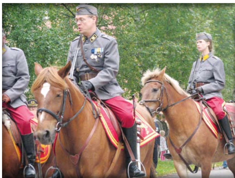
Hämeen Ratsujääkäripataljoonan ja Ratsumieskillan perinnepäivän paraatissa oli mukana myös Lahden Eskadroonan viisi ratsukkoa, jotka käyttivät pukumallia -36. s. 3