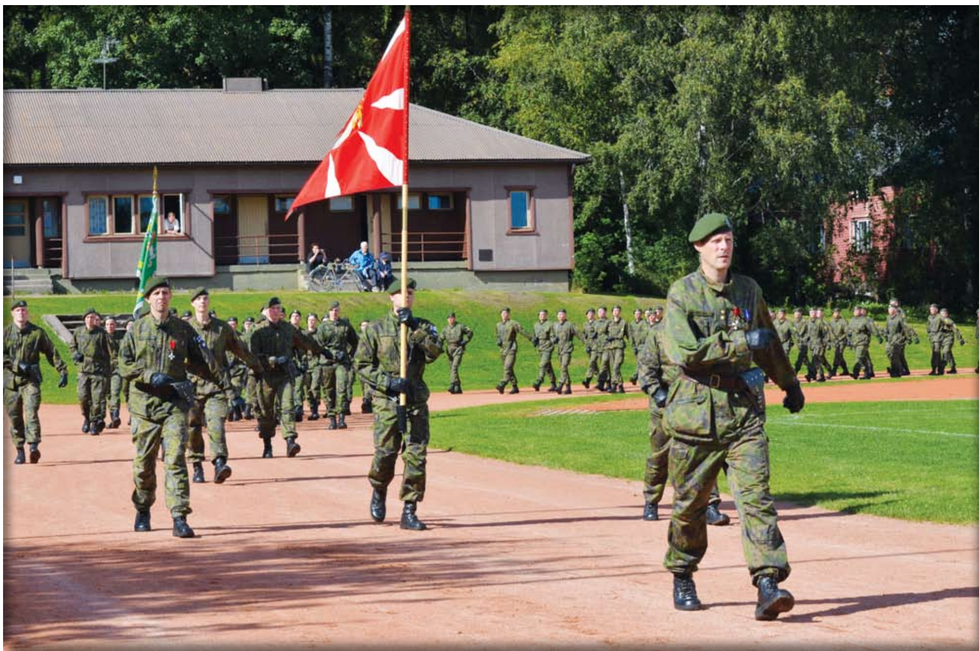
Hämeen Rykmentin sotilasvala Kärkölässä

Päijät-Hämeen Reservipiiri ry:n tiedotuslehti 3/2013