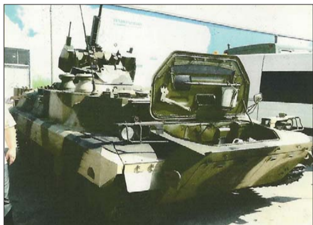
Modernisoitu kuljetuspanssarivaunu MT-LB-M

Ilmavoimien varustaminen on jo käynnistetty muun muassa 100 taistelukoneen ja 100 helikopterin tilauksella. Kaikkiaan on tarkoitus hankkia yhteensä 600 uutta taistelukonetta sekä yli 1000 helikopteria. Ilmavoimien modernisointihankkeeseen kuuluu viidennen sukupolven T-50 hävittäjä, jonka prototyyppi lensi ensilentonsa maaliskuussa. Venäjä uudistaa myös kuljetuskonelaivastoaan. Iljushin Il-76 -kalustosta modernisoidaan 60 prosenttia vuoteen 2015 mennessä. Antonov An-124 kuljetuskoneiden tuotanto aloitetaan uudelleen. Nämä toimet taakaavat myös maahanlaskujoukkojen ilmakulje-