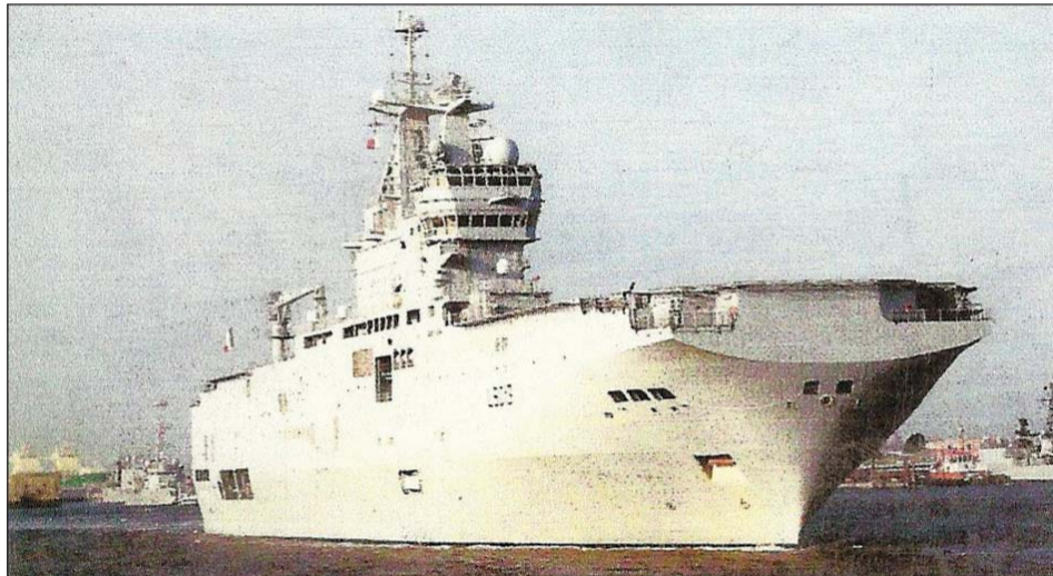
Ranskalainen Mistral-luokan helikopterilentotukialus.