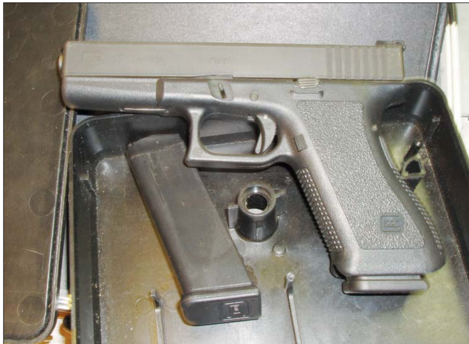
Glock 17, itselataava kertatuli