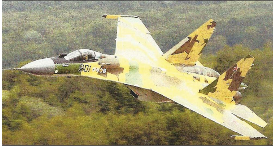
Suoi Su-35 S on Venäjän uusinta hävittäjäkalustoa.