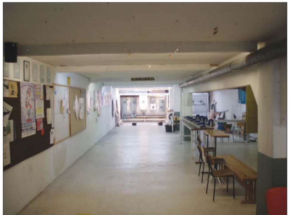
Harjoittelusta huolimatta jotkut laukaukset ovat löytäneet tiensä valolaitteisiin.