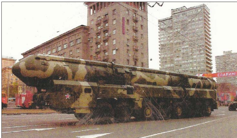
Strategisten ohjusjoukkojen ajoneuvoalustalle sijoitettu SS-27 Topol-M ohjus.