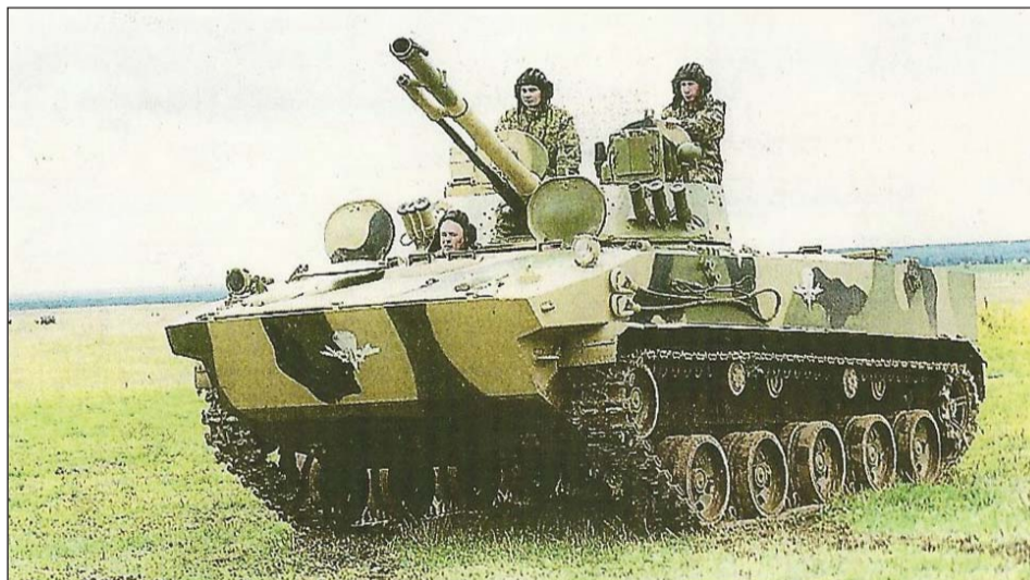
Maahanlaskujoukkojen laskuvarjopudotuskelpoinen rynnäköpanssarivaunu BMD-4M.