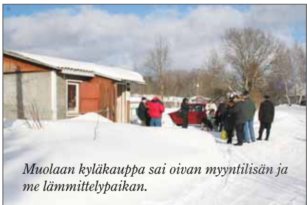
Muolaan kyläkauppa sai oivan myyntipaikan ja me lämmittelypaikan.