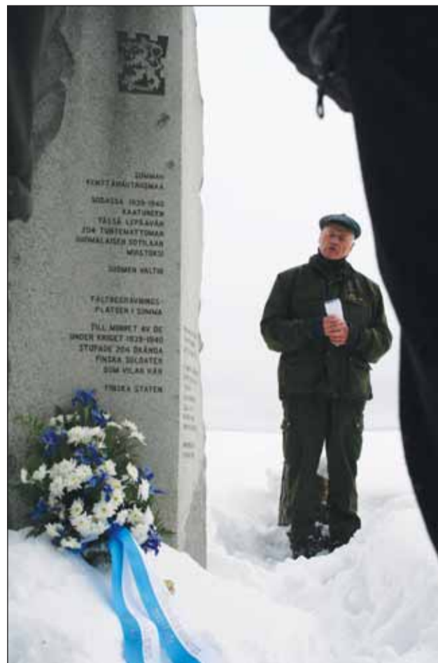
Summan muistomerkki

Virallinen Viipuri tulkitsee historiaa omalla tavallaan. Juuri rauhan-tulon hetkellä 13.3. järjestettiin taistelunäytös, jossa "Viipuri vallattiin äkkirynnäköllä, kuten 70 v. aiemminkin". Todellisuudessa rintamalinja kulki Patterinmäel-