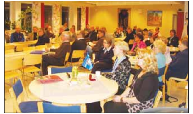
Piirien yhteiskokous Orimattilassa oli naisten järjestämä.