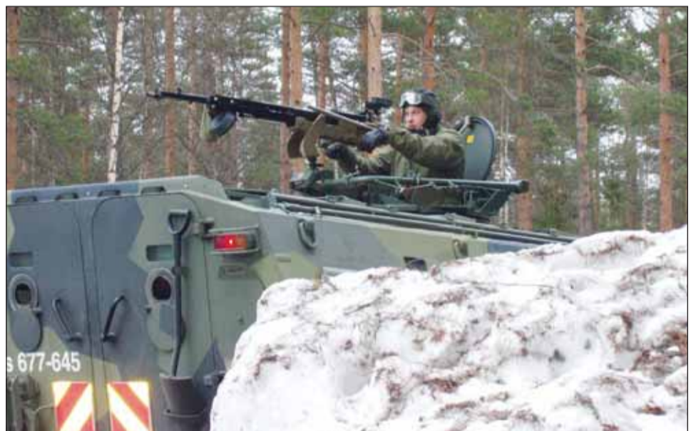
Pasit tulivoimaisine kalustoineen osallistui harjoitukseen.

Hälvälän harjoitusalueelle on tullut ympäristön asujen toimesta Hollolan kunnalta outoja rajoituksia, mitkä rajoittavat toimintaa.