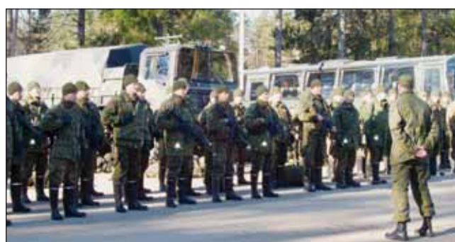
Alkuvalmistelut päätöksessä, valmiina toimeen.

Kunnan toiminta hämmästyttää meitä aktiiveja reserviläisiä. Alue on rykmenttillemme tärkeä ja mahdollistaa Lahden Varuskunnan toiminnan monipuolisena jatkossakin. Valtaosa rykmentin henkilöstöstä ja muista työläisistä asuu Hollolan kunnassa ja tuovat kuntaan arvokkaita verorahoja. Tulevaisuudessa