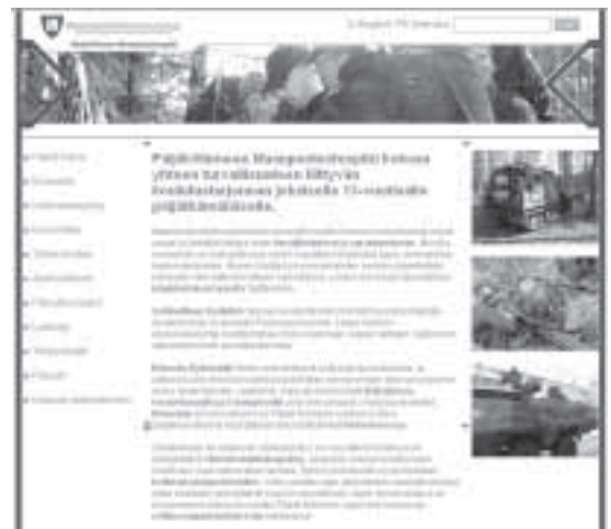
Tietoa piirin koulutustarjonnasta