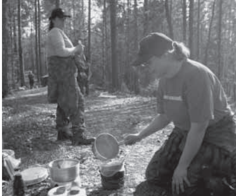
Harjoituksessa päästiin kertaamaan myös aina tärkeitä maastotaitoja.