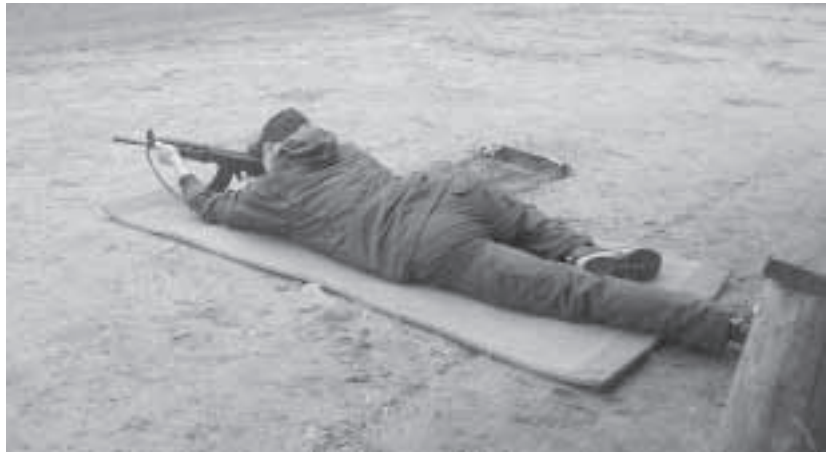
Reserviläiskunnan vähiten hikinen osa-alue

Lisäksi jokaiselle päijäthämäläiselle on tarjolla maakuntatuntemusta, luontoelämyksiä ja suunnistustaitoja Sotilassuunnistus –kurssilla, joka käynnistyy heinäkuun alussa. Tarkemmat tiedot ja ilmoittautuminen verkossa www.mpkry.fi – Päijät-Häme – Sotilassuunnistus tai kurssin johtaja Jan Heinänen, puh. 040 554 7285. Älä arastele, vaikka kompassi olisikin ennättänyt pölyttymään – taso on sovittavissa