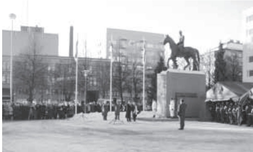
Kuva 13.3 tilaisuudesta vuorossa seppeleenlasku.