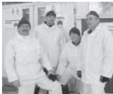
Nastolan joukkue, kuvasta puuttuu Pauli Salminen.

Nastolan Reserviläiset ja Reserviupseerit osallistuivat hiihtoon, sen sprintti osuuteen joka on mitaltaan runsas 30 km ja osa matkasta hiihdettiin pimeällä. Lähtö Kausalan ravilinnasta tapahtui 25.2 iltapäivällä klo 15.30 hyvän