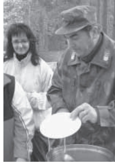
Uusi laki ei juurikaan vaikuta perinteiseen maanpuolustustyöhön. Kuvassa kenttäruokailu vuoden 2003 huipputapahtumasta.

Kiivaimpien reserviläisaktiivien on myös hyvä palauttaa mieleen ne historialliset syyt, joiden johdosta Suomessa suhtaudutaan monia muita maita varauksellisesti puolustusvoimien ulkopuolella ja ilman viranomaisval-