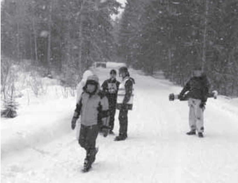
Olosuhteet olivat erittäin talviset, kuten talvijotokselle soippkin.

nen ja kivääriammunta. Kilpailijat mainitsivat pitäneensä erityisesti tästä ampumarastista, joka poikkesi edukseen tavanomaisesta kouluammunnasta. Rastilla partio jaettiin kahteen osaan, jokaiselle jaettiin kaksi lipasta joissa kaksi + kolme patruunaa. Maalit olivat kaatuvia, paikallaan olevia ja liikuvia. Pisteitä tuli taulujen vaikeusasteen mukaan. Toinen partion osa ei nähnyt kaikkia maaleja, joten tulta piti pystyä keskittämään ja harkitsemaan mitä maaleja ampui. Aseina olivat reserviläiskiväärit. Parhaiten toimivaksi rastiksi nimettiin aseiden kokoaminen.