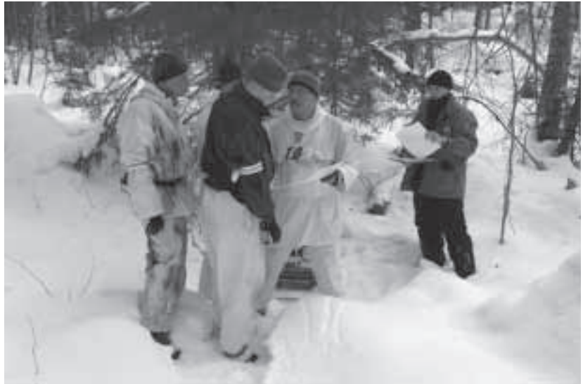
Tehtävä on saatu, nopea käskytyks ja töihin.

Jotoksen järjestelyvastuuta tarjottiin sysmääläisille vasta marraskuun 2005 loppupuolella alkuperäisen kisaorganisaation vetäytyttyä hankkeesta. Tämän kokoisia tapahtumia valmistellaan yleensä vuosi, pari, mutta nyt aikataulu oli tiukka. Kilpailun järjestäminen otettiin vastaan suurena haasteena ja mielenkiintoisena kokemuksena. Nopeasta aikataulusta huolimatta järjestelyt sujuivat mallikkaasti. Kisaorganisaatio teki huolellista valmistelu- ja järjestelytyötä. Vastuuta jaettiin ja jokainen tiesi, mitä tehdä. Kaikkiaan järjestelyissä oli mukana kisapäivinä (pe-su) noin 70 henkeä. Apuvoimia saatiin mm. Lahdesta, Padasjoelta, Kärkölästä ja Asikkalasta. Vahvoina taustavaikuttajina