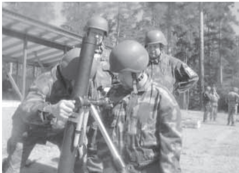
Suuntaaminen on tarkkuutta vaativaa työtä.

Paikallisosasto omalta osaltaan hahmottaa alueellaan tarvittavia