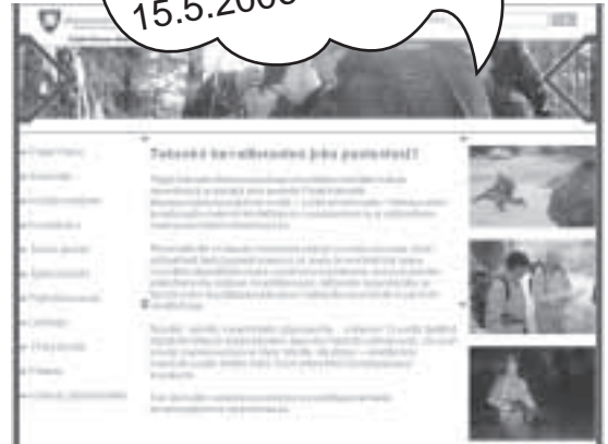
Piirin etusivu toivottaa paikalliset tervetulleiksi

Surffaa Päijät-Hämeen maanpuolustuspiirin uusille verkkosivuille www.mpkry.fi/paijat-hame 15.5.2006 alkaen!