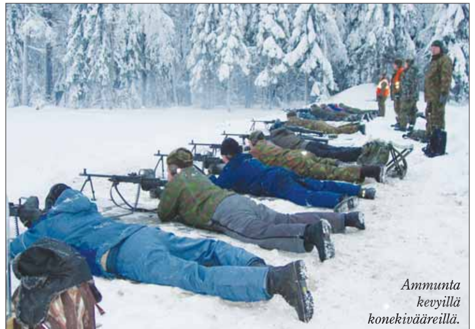
Ammunta kevyillä konekivääreillä.