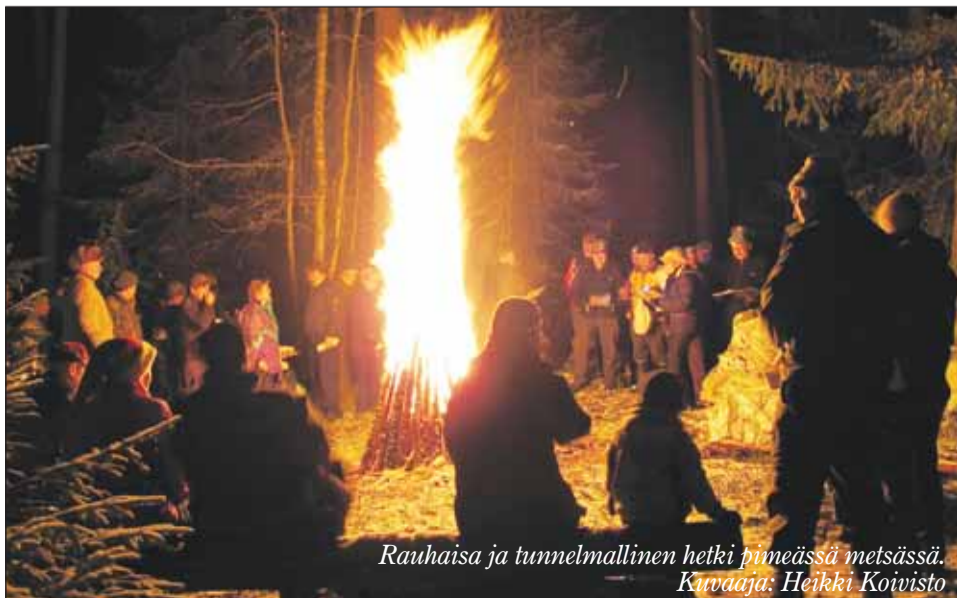
Rauhaisa ja tunnelmallinen hetki pimeässä metsässä.