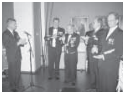
Reserviläisliiton historiikin saajat.

Tilaisuudessa pal-kittiin seuraavat ansioituneet maanpuolustajat :