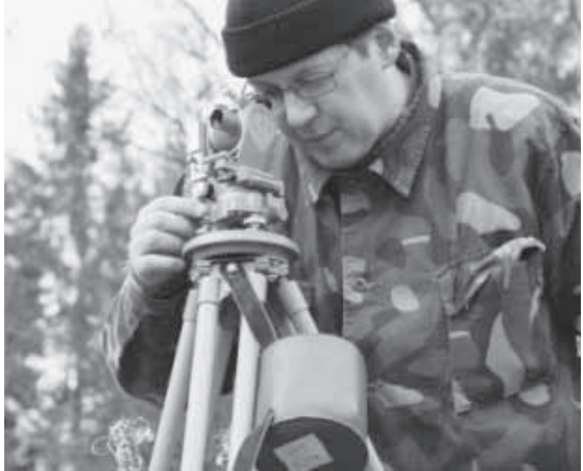
Teoriaosuudella läpikäytyt tiedot joutuivat maastossa kovaan testiin.

uksella. Illan jatkoksi mittausryhmä perusti mittaripisteen. Tähtimittauksista harjoitus keskittyi ensimmäisenä iltana Pohjantähtimittaukseen.