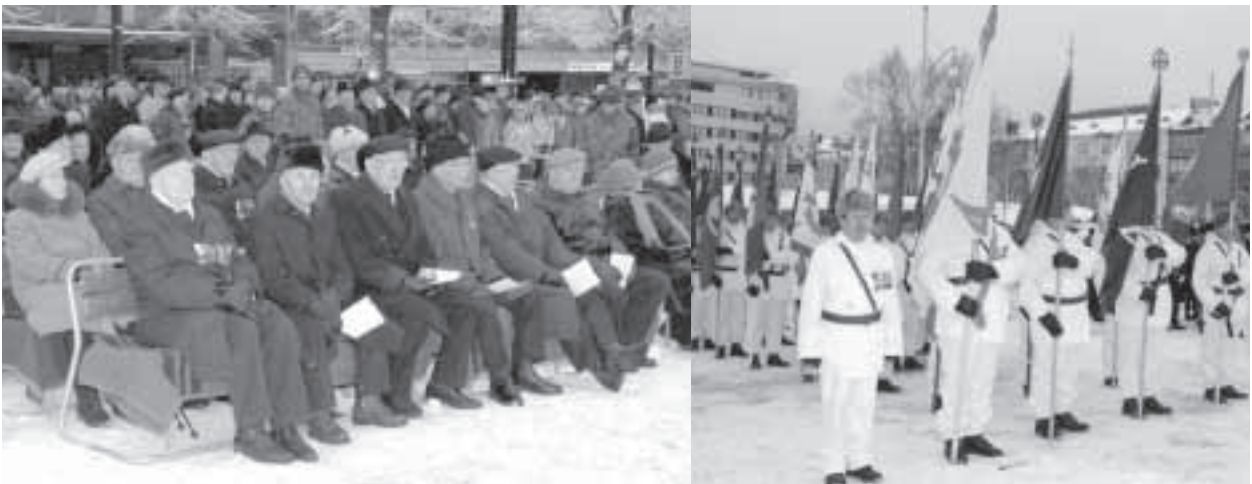
Veteraanit kunniapaikalla reserviläisten hoitaessa ensimmäisen kerran heidän lipunkantotehtävänsä.

Jalan marssiva osasto olisi voinut hyvinkin jatkaa aina Vesijärven kadulle asti ja siellä vasta poistua ajoneuvo-osaston marssireitiltä.