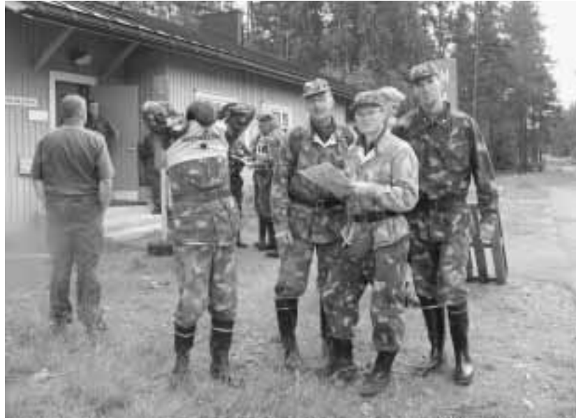
Numerolappu rintaan ja sitten menoksi. 7 Hämsle

Kilpailuun kuului ammuntaa, erilaisia tehtävärasteja, pikamarssi sekä suunnistusosuus. Rastitehtävät olivat suurimmalta osalta varsin tuttuja, mutta kuten Lylyisen luonteeseen kuuluu oli tälläkin kertaa haettu myös jotain uutta. Yllättävin tehtävä oli tällä kertaa erilaisten tietokoneen korttien ja liittimien tunnistaminen. Kilpailijat saivat koko viikonlopun nauttia varsin hyvästä säästä, satunnaiset sadekuurotkin menivät nopeasti ohi kastelematta kilpailijoita sen enempää.