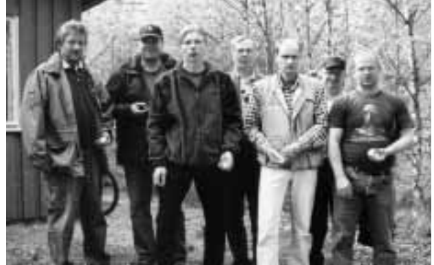
Asikkalan joukkue kilpailun jälkeen.

Päijät-Hämeen Reserviläispiirin pistooli-cup ammunnan loppuottelu Orimattilan ampumaradalla 17.07. klo.11.00 Hartolan (Ha), Orimattilan (Or), Asikkalan (As) ja Artjärven (Ar) yhdistysten kesken.