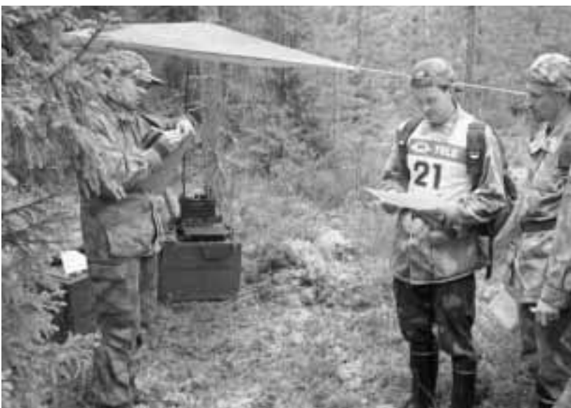
Tehtävä on saatu ja ankara miettiminen alkaa. Sanla-rasti oli huomattavasti viimevuotista helpompi.