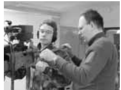
Lauantai aamupäivän rastikoulutus oli erittäin hyvin järjestetty ja koulutukseen osallistuneet kiittelivätkin mielenkiintoista ohjelmaa.

Tulevaisuudessa olisi hienoa, jos läänin esikunta lähtisi mukaan käskyjen lähettämiseen, kuten esim. Helsingissä ja Uudellamaalla. Saisimme näin ennakkoon tietää keitä on tulossa harjoitukseen.