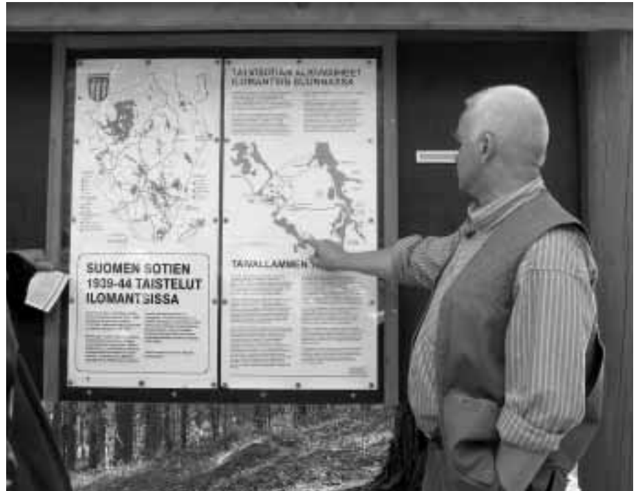
Ilomansin taistelutilanteisiin pystyi syventymään myös opastaulun karttapiirroksista.