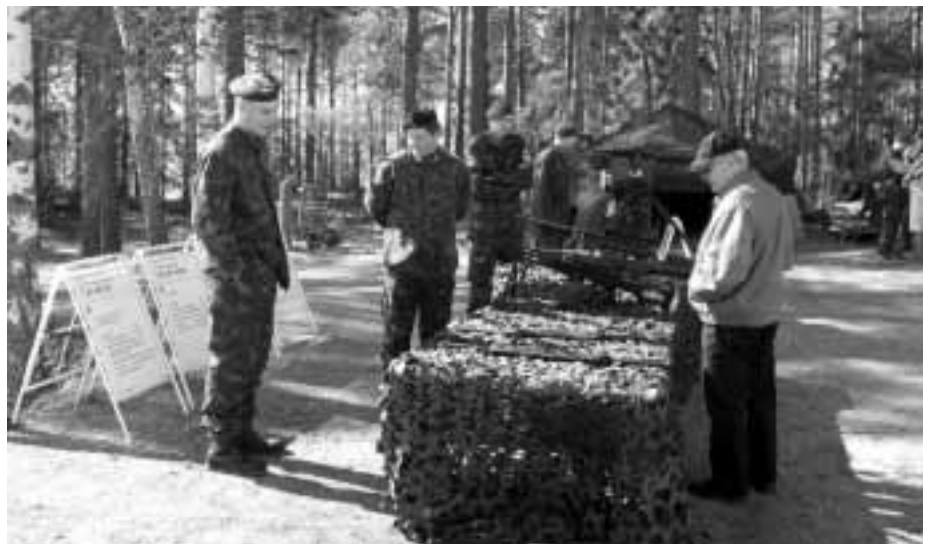
Kalustoesittelyyn osallistui asikkalalaisia reserviläisiä.