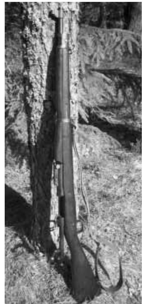
Kilpailun vaatimuksen mukainen sotilaskivääri.