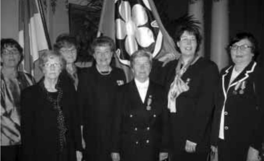
Päijät-Hämeen edustajat lipunnaulaustilaisuudessa.

Maanpuolustusnaisten Liittoryn lipunnaulaus ja siunaustilaisuus pidettiin 5. toukokuuta Katajanokan Kasinolla Kenraalisalissa. Päijät-Hämeen piirin yhdistyksistä juhlaan osallistui Kärkölän, Lahden, Nastolan ja Orimattilan edustajat. Lisäksi Kenraalisaliin kokoontui kutsuvieraiden lisäksi iso joukko jäseniä ympäri Suomea. Olihan kyseessä varsin historiallinen tapahtuma.