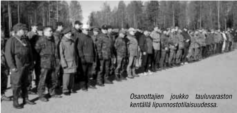
Osanottajien joukko tauluvaraston kentällä lipunnostotilaisuudessa.

suurimmat mitä koskaan oli ennen järjestetty. Kilpailuun osallistui noin 160 ampujaa ympäri Suomea.