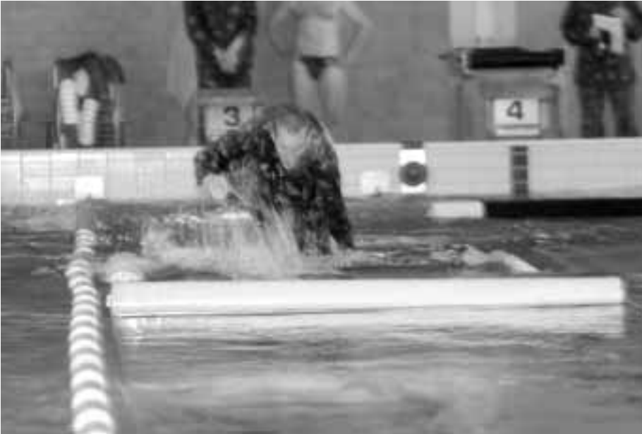
Esteuintiosuus on näyttävän ja haasteellisen näköinen laji.

voi tapahtua myös ilman kompassia tai vaikka peitepiirroksen avulla ilman karttaa.