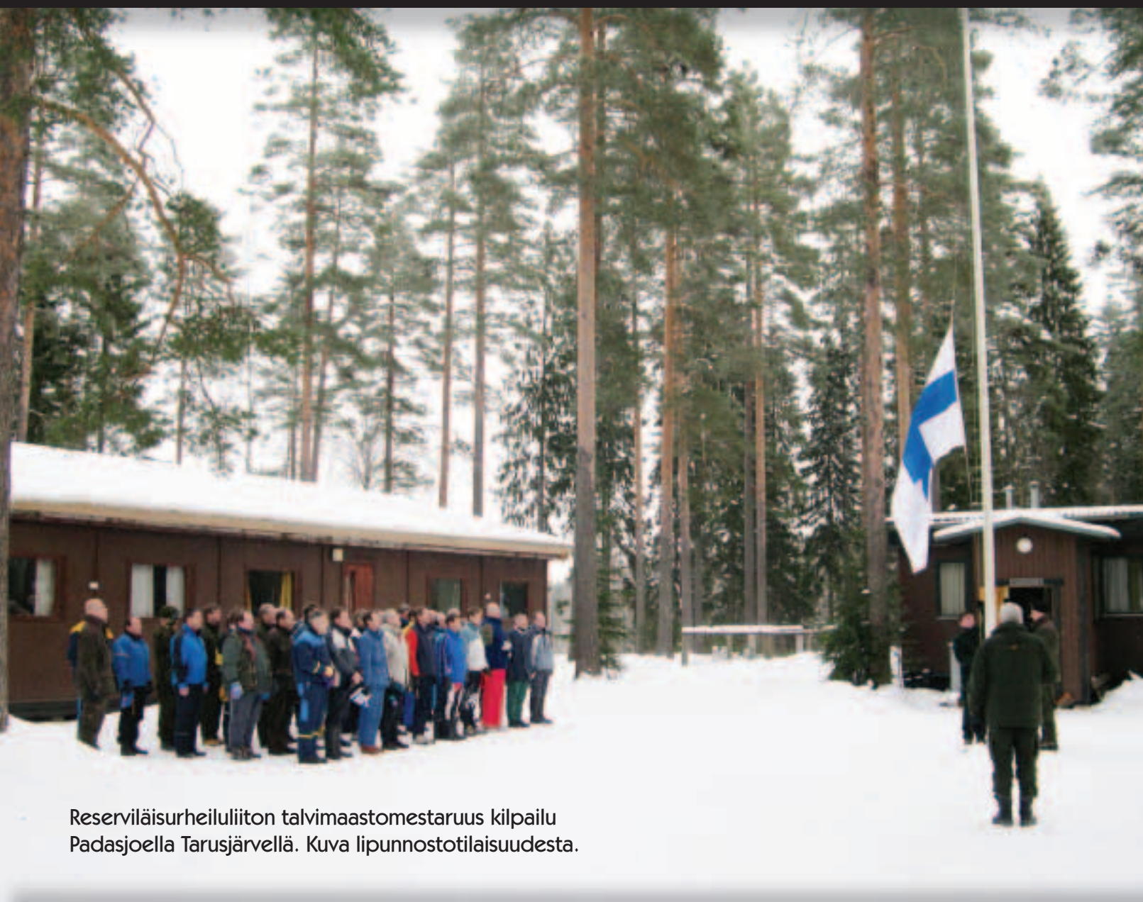
Reserviläisurheiluliiton talvimaastomestaruus kilpailu Padasjoella Tarusjärvellä. Kuva lipunnostotilaisuudesta.

Päijät-Hämeen Reserviläispiiri ry:n tiedotuslehti 2/2007