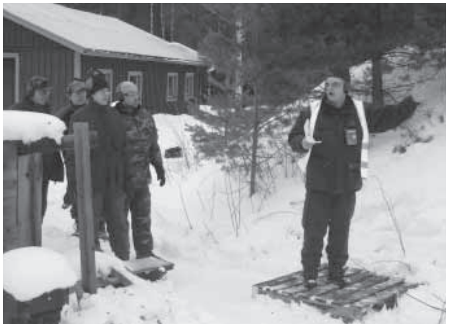
Ampujia käskytettiin huolellisesti toimintaradalle rakennetulla kiväärirastilla.

Kilpailu ammuttiin varsin mukavissa olosuhteissa. Kiväärirasteista kaksi oli sijoitettu kivääriradalle, jossa ampumakatoksesta ammuttiin erilaisiin tauluihin 150 m:n matkalle. Toimintaradalle sijoitetulla radalla