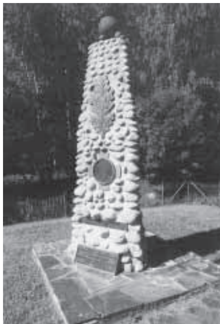
Veteraanien muistopaasi sijaitsee paikassa josta Padasjoen miehet ja pojat lähtivät 22.6.1941 jatkosotaan.

Lahden Sotaveteraanipiirin alueen pitäjästä on paikallisten Sotaveteraaniyhdistysten toimesta kerätty mittava kuvateos viime sotiimme 1939-1945 liittyvistä, sekä aiemmin lähinnä itenäisyytemme aikana pystytetyistä muistomerkeistä.